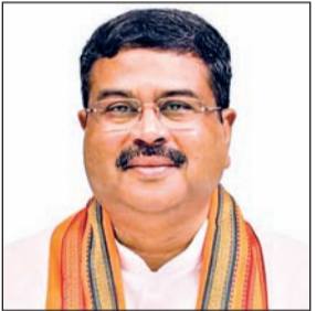
बीजेपी अध्यक्ष जेपी नड्डा ने दोनों नेताओं को कर्नाटक का

भुवनेश्वर/नयी दिल्ली। केंद्रीय मंत्री शिक्षा मंत्री धर्मेंद्र प्रधान को बीजेपी ने कर्नाटक का प्रभारी नियुक्त किया है। राज्य में चुनाव नजदीक आते देख भाजपा ने इस गुरु दायित्व की जिम्मेदारी धर्मेंद्र को दी है। धर्मेंद्र के साथ तमिलनाडु बीजेपी अध्यक्ष के अन्नामलाई को कर्नाटक का सह प्रभारी नियुक्त किया गया है।