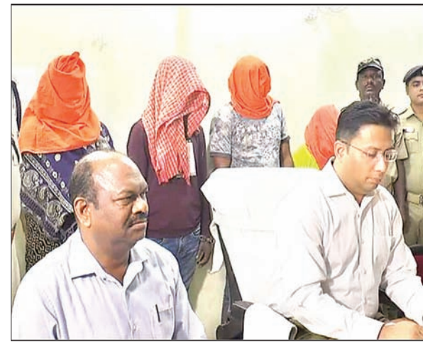
गठित की गई और जगह-जगह पर छापेमारी किया गया। हालांकि