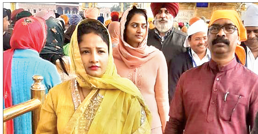
सीएम हेमंत सोरेन ने बुधवार को स्वर्ण मंदिर में धर्मपत्नी संग माथा टेक कर झारखंडवासियों की सुख, शांति, समृद्धि और स्वस्थ जीवन की कामना की।

उसका विषय था- द राइज एंड डिक्लाइम ऑफ इंडियाज कांग्रेस पार्टी। मुझे विश्वास है कि भविष्य में कांग्रेस को बर्बादी पर हॉर्नबिल नहीं, बड़े-बड़े विश्वविद्यालयों में अध्ययन होना ही होना है और कांग्रेस को डुबाने वाले लोगों पर भी अध्ययन होने वाला है। ऐसे लोगों के लिए दुष्यंत कुमार ने बहुत बढ़िया बात कही है। उन्होंने कहा है- 'तुम्हारे पांव के नीचे कोई जमीन नहीं, कमाल ये है कि फिर भी तुम्हें यकीन नहीं?'