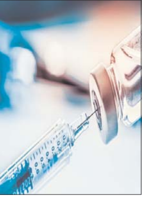
नहीं लग पाया है। 11.40 लाख लोगों को बूस्टर डोज टीका लगाने का लक्ष्य रखा गया है।

9 फरवरी तक बर्बाद हो जायेंगे कोविशिल्ड के 920 डोज, खपत के लिए प्रभारियों को निर्देश