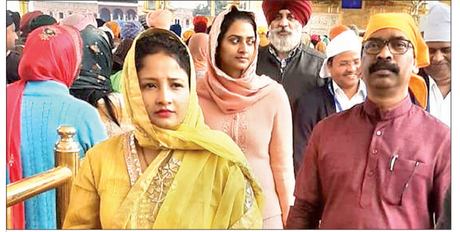
सीएम हेमंत सोरेन ने बुधवार को स्वर्ण मंदिर में धर्मपत्नी संग माथा टेक कर झारखंडवासियों की सुख, शांति, समृद्धि और स्वस्थ जीवन की कामना की।

उसका विषय था- द राइज एंड डिक्लाइन ऑफ इंडियन कांग्रेस पार्टी। मुझे विश्वास है कि भविष्य में कांग्रेस को बर्बादी पर हॉर्नबिल नहीं, बड़े-बड़े विश्वविद्यालयों में अध्ययन होना ही होना है और कांग्रेस को डुबाने वाले लोगों पर भी अध्ययन होने वाला है। ऐसे लोगों के लिए दुष्यंत कुमार ने बहुत बढ़िया बात कही है। उन्होंने कहा है- 'तुम्हारे पांव के नीचे कोई जमीन नहीं, कमाल ये है कि फिर भी तुम्हें यकीन नही?'