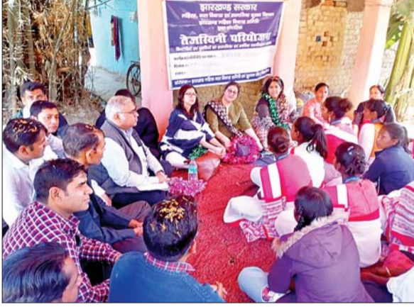
किशोरियों से जानकारी लेते विश्व बैंक की टीम में शामिल पदाधिकारी।