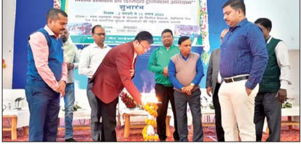
जेएसएलपीएस के डीपीएम समेत बड़ी संख्या में स्वयं सहायता समूह की दीदियां उपस्थित रहीं। इस