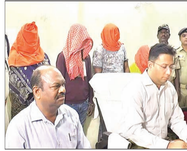
गठित की गई और जगह-जगह पर छापेमारी किया गया। हालांकि