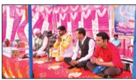
विषघर भुत प्रेत के अधिनायक और लोककल्याण में सभी भौतिक सुख सुविधा को त्याग करने वाले अनार्यों के देवता भगवान शिव के शिष्य बनने। आप सभी को शिव तभी शिष्य स्वीकारेंगे जब अपने घरों में न्यूनतम व इच्छा रहित रिश्ता बनाएंगे। भ्रूप हत्या देहेज जैसे दुगुणों पर विराम लगाएंगे। उपरोक्त बातें पाटन प्रखण्ड के इमली गांव में आयोजित शिव चर्चा में गुरु भाई बहनों के संबोधन

आजाद सिपाही संवाददाता मेदिनीनगर। दुनिया का कोई भी काम मानव जीवन के बेहतरी के लिए किया जाता है। जब हम चर्चा के जरीये शिव को याद करते हैं तो कोशिश करते हैं उनके चरित्र को अपने जीवन में उतारें। विश्वकल्याण के लिए शिव जहर का प्याला पिये, आज भी नागरिक जीवन, हमारा समाज भूख से भ्रष्टाचार से, बेरोजगारी से, शिक्षा, चिकित्सा के लिए, जाति धर्म सम्प्रदाय के आग से त्राहिमा मत्राहिमा मत्र कर रहा है इसे दफन करने की जरूरत है इसे खत्म करने की जरूरत है। यह तभी सम्भव है जब आप धरती के तमाम जीव जंतु