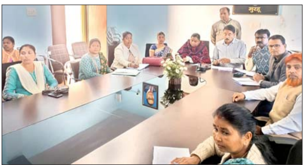
बाल संरक्षण इकाई की बैठक में उपस्थित पदाधिकारीगण।