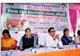
आशिक अनुदान के माध्यम से चयनित लाभुकों को बतख, मुर्गी, सुकर पालन एवं दो गाय, पांच गाय एवं 10 गाय की योजना का लाभ दी जाती है। डीसी ने बताया कि प्रखंड स्तरीय समिति से लाभुकों की सूची अनुमोदित होकर जिला स्तरीय समिति को आती है। जिसमें माननीय जन प्रतिनिधि व उनके प्रतिनिधियों की सहमति से चयनित लाभुकों की सूची का अनुमोदन किया जाता है। लक्ष्य के अनुरूप कुल 72 लाभुकों को वर्तमान वित्तीय वर्ष के लिए

चास। प्रखंड में गुरुवार को दुधारू पशु मेले का आयोजन किया गया। जिसका उद्घाटन डीसी कुलदीप चौधरी ने किया। इस अवसर पर उन्होंने कहा कि मुख्यमंत्री पशुधन विकास योजना मुख्यमंत्री हेमंत सोरेन की महत्वकांक्षी योजना है। इसका उद्देश्य राज्य की ग्रामीण अर्थ व्यवस्था को सुदृढ़ करना और ग्रामीणों को स्वावलंबी बनाना है। साथ ही, ग्रामीण क्षेत्र के लोगों में पोषण तत्वों की कमी को दूध व उसके उत्पादों से दूर करना है। कल्याण विभाग एवं गव्य विकास विभाग द्वारा पूर्ण अनुदानित एवं