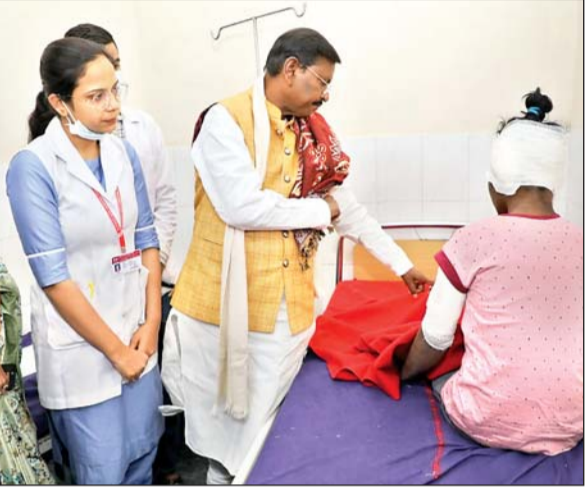
केंद्रीय जनजातीय मंत्री अर्जुन मुंडा रविवार शाम 4 बजे गुरुग्राम के सिविल अस्पताल में रांची (झारखंड) की रहने वाली 14 साल की बच्ची जिसको एक दंपति ने प्रताड़ित किया था, देखने पहुंचे।

संबंधित थाने में सुपुर्द कर इसकी सूचना जिले में गठित कैश रिलीज कमिटी को भेज दी गई है जिसके उपरांत कमिटी द्वारा आगे की कार्रवाई की जायेगी।