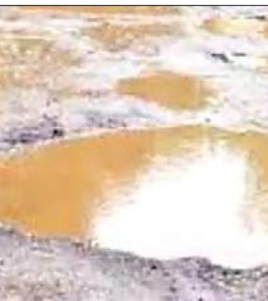
सरदमतोला नामक एक ऐसा गांव जहां आजादी के 75 साल बाद भी

बालूमाथ। झारखंड में लातेहार जिला के बालूमाथ प्रखंड मुख्यालय से 13 किलो मीटर दूरी स्थित भोग्या पंचायत के अंतर्गत दस हजार आवादी वाला