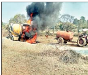
लगे मिक्सचर मशीन और ट्रैक्टर में आग लगा दी। जाने के पहले उन्होंने संगठन से आदेश नहीं मिलने तक काम बंद रखने का निर्देश देते हुए घटना को अंजाम देकर चलते बने। यह सड़क रांची रोड दुलसुलमी से केड तक बनाई जा रही है। इधर सूचना मिलते ही पहले सतबरवा पुलिस उसके बाद मनिंका पुलिस घटनास्थल पर पहुंची और अनुसंधान शुरू कर

आजाद सिपाही संवाददाता सतबरवा/पलामू। मनिंका थाना क्षेत्र के रांकी कला गांव में मंगलवार को नक्सलियों ने मंगलवार को दिनदहाड़े सड़क निर्माण कार्य में लगे मशीन और ट्रैक्टर को आग के हवाले कर दिया। नक्सलियों ने सड़क निर्माण का कार्य बंद करने की धमकी भी दी है। घटना में शामिल नक्सलियों ने खुद को टीपीसी से जुड़ा बताया है। प्राप्त जानकारी के अनुसार घटना लगभग दोपहर 2:00 बजे की है। मोटरसाइकिल पर सवार होकर नक्सली मंगलवार की दोपहर रांकी कला के पास सड़क निर्माण कार्य स्थल पर पहुंचे और मजदूरों को धमकी देकर कार्य बंद करा दिया। वहीं मौके पर काम में