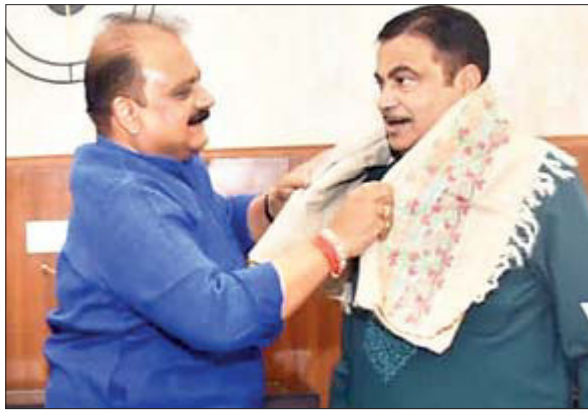
राष्ट्रीय राजमार्ग मंत्री ने दिया समस्या के निदान का आश्वासन