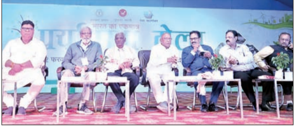
निमोनिया की चपेट में आ रहे हैं। बढ़ते प्रदूषण के कारण आम आदमी ज्यवा डिप्रेस्ड में जी रहा है। छत्तीसगढ़-दिल्ली में इंडस्ट्रियल पोल्यूशन बहुत ज्यादा