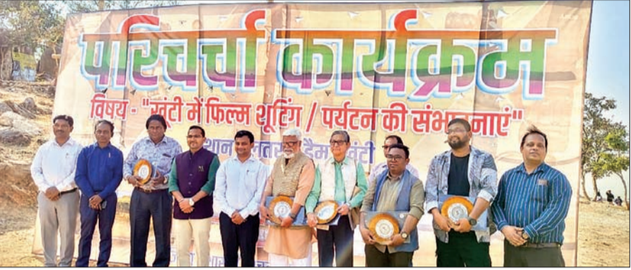
फिल्म शूटिंग की संभावनाओं को देखते हुए जिले में आवश्यक प्रबंध किए जाएंगे। साथ ही भगवान बिरसा मुंडा की जन्मस्थली उलहातू में विशेष उलहातू महोत्सव किया जाएगा। डीसी ने बताया कि जिले में 3 स्टार होटल बनाने की कार्य योजना तैयार की जा रही है। साथ ही पर्यटन को बढ़ावा देने के उद्देश्य स्विस् कोंटेज, होमस्टे, रॉक क्लिमलिंग, कैम्पिंग, ट्रेकिंग की व्यवस्था की जाएगी। साथ ही फूदी में ट्राइबल पार्क को विकसित करने की योजना बनाई जा रही है।

आजाद सिपाही संवाददाता खूंट्टी। उपायुक्त के निर्देश पर सूचना एवं जनसंपर्क विभाग खूंट्टी के सहयोग से लतरातू डैम खूंट्टी में शुरुकार को फलम शूटिंग और पर्यटन की संभावनाओं पर परिचर्चा का आयोजन किया गया। इस दौरान फिल्म के क्षेत्र में योगदान देनेवाले और पत्रकारों से चर्चा की गयी। उपायुक्त ने कहा कि खूंट्टी प्राकृतिक सौंदर्य से परिपूर्ण जिला बहुत ही सुन्दर जिला है और यहाँ पर्यटन की अपार संभावनाएँ हैं। उन्होंने कहा कि फिल्मों की शूटिंग करने आए कलाकारों के लिए भी आवश्यक व्यवस्था की जाएगी। उन्होंने कहा कि फिल्म के बढ़ते कदम से स्थानीय लोगों को भी रोजगार उपलब्ध होगा। डीसी ने कहा कि कोई भी फिल्म की शूटिंग किसी जगह होती है, तो पूरी यूनिट आती है। उन्हें रहने, खाने एवं अन्य चीजों की जरूरत पड़ती। इसका प्रत्यक्ष लाभ यहाँ के स्थानीय लोगों को मिलेगा। खूंट्टी जिले में अन्य जिलों के लिए उदाहरण बनने की क्षमता है।