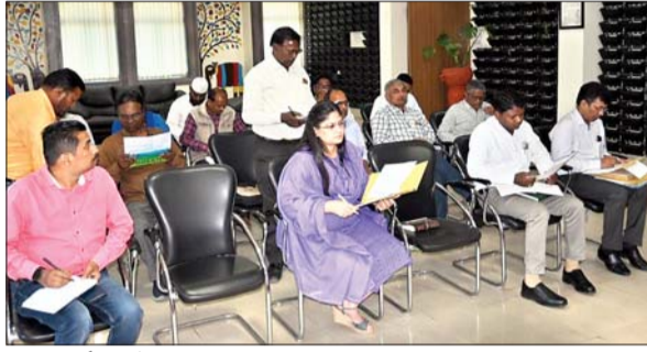
डीसी की बैठक में उपस्थित पदाधिकारी।