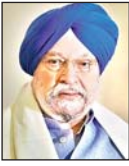
हरदीप सिंह पुरी

शहरी 20 कार्य समूह का उद्घाटन 9-10 फरवरी 2023 को अहमदाबाद में किया गया था। शहरी 20, या यू20, हर वर्ष आयोजित होने वाली सबसे प्रभावशाली शहर-स्तरीय कूटनीति पहलों में से एक है। जी-20 समूह के महापौरों और नामित 'सिटी शेरपाओं' की भागीदारी के साथ, यू20 में हुए विचार-विमर्श जी-20 के तहत होने वाली वाताओं की जानकारी देते हैं और वे शहरी विकास से जुड़े विस्तृत विचार-विमर्श का महत्वपूर्ण हिस्सा हैं। उद्घाटन बैठक में 42 शहरों के 70 से अधिक प्रतिनिधियों ने भाग लिया- यू20 की स्थापना के बाद से इसमें सबसे बड़ी उपस्थिति दर्ज की गयी। यह उचित है कि भारत इस वर्ष शहरीकरण और शहरी गतिशीलता पर चर्चा कर रहा है। मोदी सरकार के तहत, भारत ने वैश्विक शासन के मुद्दों पर कार्यों का तेजी से नेतृत्व किया है। ऐसी ही एक सफलता की कहानी हमारे शहरी क्षेत्रों का परिवर्तन है जो अब अन्य देशों विशेष रूप से वैश्विक दक्षिण में अन्य देशों के लिए सीख लेने का ब्यूफ्रिंट बन गया है। इस साल के यू20 का उद्देश्य विकास के वैश्विक एजेंडे पर शहरों द्वारा अपनायी गयी नीतियों और कार्य-प्रणालियों के जबरदस्त प्रभावों पर प्रकाश डालना है।