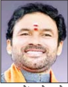
जी किशन रेड्डी

डिब्रू-सादिया रेलवे के पहले लोकोमोटिव ने 1882 में ब्रह्मपुत्र के साथ दूर के चाय-बागानों को जोड़ा, ताकि वस्तुएं अंततः कोलकाता तक पहुंच सकें। दशकों बाद, रेलवे डिब्रूगढ़ से कोलकाता तक यात्रा की अवधि को 15 दिनों से घटाकर 24 घंटे तक करने में सफल रहा है। हालांकि, 2014 तक, पूर्वोत्तर में रेलवे की सेवाएं मुख्य रूप से वर्तमान के असम तक ही सीमित रही। पिछले 8 वर्षों में, पूरे पूर्वोत्तर क्षेत्र में रेलवे के विस्तार को सुनिश्चित करने के लिए बड़े पैमाने पर कार्य किए गए हैं और जिस धैर्य व दृढ़ता से इस सपने को साकार किया गया है, उसे लोगों के सामने लाये जाने की आवश्यकता है।