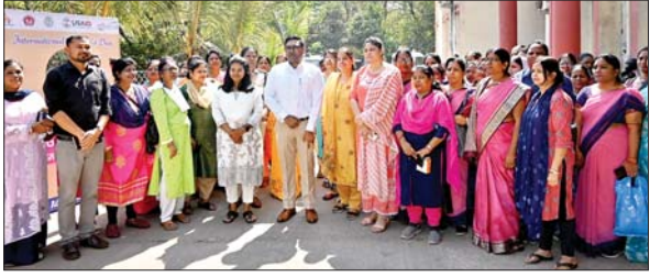
अंतरराष्ट्रीय महिला दिवस पर आयोजित कार्यक्रम में शामिल डीसी व अन्य।

आजाद सिपाही संवाददाता बोकारो। महिलाएं किसी भी क्षेत्र में कम नहीं हैं। अगर जिले की बात करें तो प्रशासनिक महकमा में भी महिलाएं अपनी दक्षता/क्षमता के माध्यम से शीर्ष पदों पर आसीन हैं। कार्य कुशलता से अपने दायित्व का निर्वहन कर रही हैं। महिलाएं बस अपने अधिकारों को जानें, उससे जागरूक हों। महिलाओं को साक्षर बनाने के लिए कौन-कौन से कानून बने हैं, कौन सी योजनाएं सरकार द्वारा संचालित हैं। उसे जानें और उसे हासिल करने के लिए संघर्ष करें।