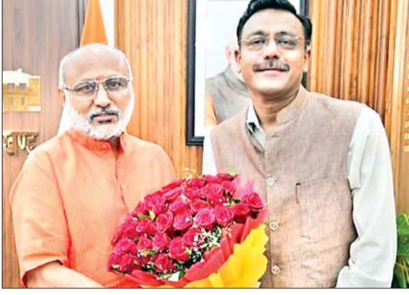
जिनसे सरकार द्वारा दी जाने वाले आरक्षण का लाभ मिल सके और उनका प्लेसमेंट सहज हो। राज्यपाल ने विश्वविद्यालय में अध्ययनरत जनजातीय विद्यार्थियों की जानकारी मांगी है। राज्यपाल ने जल्द ही विश्वविद्यालय भ्रमण की बात कही तथा विश्वविद्यालय में छात्रों के नामांकन की प्रक्रिया,