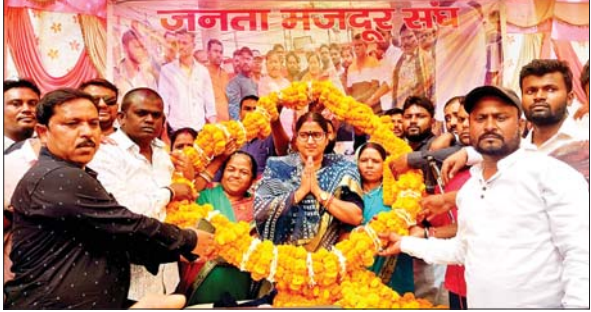
रागिनी सिंह को फूलों का हार पहनाकर स्वागत करते जमस कार्यकर्ता।

लोयाबाद। जनता मजदूर संघ (जमस) और हममें हमेशा अत्याचार के खिलाफ लड़ाई लड़ी है। हमेशा लड़ते भी रहेंगे। बढ़ते अपराध पर हमेशा मुखर होकर बोली हूँ और आगे भी बोलती रहूँगी। कभी चुप नहीं रहूँगी। उक्त बातें जमस की संयुक्त महामंत्री सह भाजपा नेत्री रागिनी सिंह ने कही। वे रविवार को बासदेवपुर कोलियरी में आयोजित जमस की सभा को संबोधित कर रही थीं। उन्होंने कहा कि झारखंड की महागठबंधन सरकार पर धनबाद का प्रशासन ज्यादा उछल-कूद ना मचाए। जल्द ही सरकार बदलेगी और झारखंड में भी योगी बाबा जैसी ही बुलडोजर वाली सरकार बनेगी। इसलिए प्रशासन पहले निष्पक्ष जांच करे, फिर कार्रवाई करें। रागिनी सिंह ने अपने ससुर