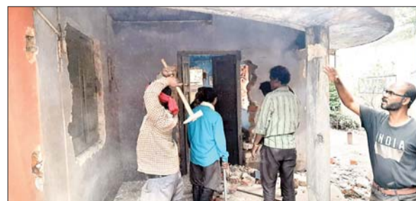
बीटी सेंटर को ध्वस्त करते मजदूर।