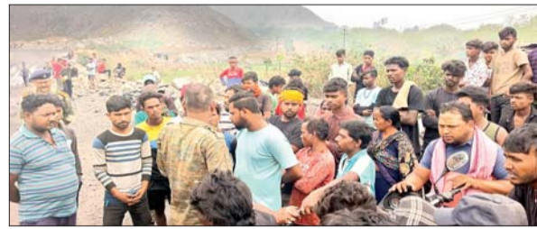
लोगों को समझा बुझा कर शांत कराने की कोशिश करता पुलिस का जवान।