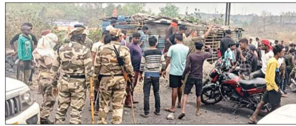
दो गुटों के बीच संघर्ष के बाद मौके पर पहुंची पुलिस।

धनसार। झरिया थाना क्षेत्र के बस्ताकोला आउटसोर्सिंग कैम्प के समीप रविवार को ट्रांसपोर्टिंग हाइवा से कोयला उतारने को लेकर दो गुटों में जमकर मारपीट हो गई। दोनों ओर से जमकर लाठी डंडा और पत्थरबाजी की गई। इस घटना में कई लोग घायल भी हो गए। उधर, घटना की सूचना पाकर बस्ताकोला एरिया के सीआइएसएफ एवं झरिया पुलिस मौके पर पहुंची और सभी को खदेड़ दिया। जिसके बाद धीरे-धीरे मामला शांत हुआ। वहीं झरिया पुलिस घटनास्थल पर पहुंच जांच में जुट गई है। जबकि मारपीट में शामिल दोनों पक्षों ने एक-दूसरे पर आरोप लगाए हैं।