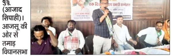
बुँडू (आजाद सिपाही)। आजसू की ओर से तमाड़ विधानसभा