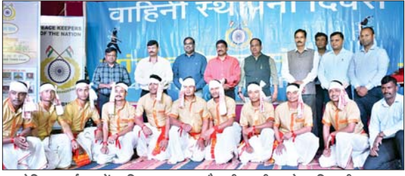
आयोजित कार्यक्रम में शामिल कलाकार और सीआरपीएफ के अधिकारी-जवान।

आजाद सिपाही संवाददाता मेदिनीनगर। सीआरपीएफ जवानों की जांबाजी से पलामू प्रमंडल सहित अन्य जिलों एवं अंतरराज्यीय सीमाओं पर शांति व्यवस्था कायम है। सीआरपीएफ की वीरता की कई गाथाएं हैं। नक्सल विरोधी अभियान में सीआरपीएफ 134 बटालियन की अहम भूमिका रही है। बूढ़ा पहाड़ का क्षेत्र चारों तरफ से आइडी से घिरा था। जवानों ने वीरता दिखाते हुए इसे नक्सल मुक्त कराया। बूढ़ा पहाड़ अभियान में 134 बटालियन के जवानों की भी अहम भूमिका रही। जवानों ने इसे नक्सलियों से मुक्ति दिलाई, जिससे क्षेत्र में शांति व्यवस्था कायम है। इसकी