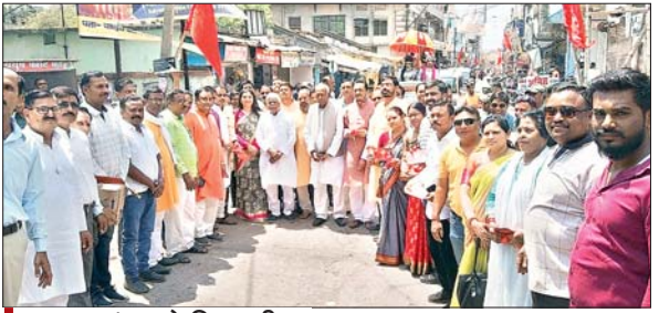
पलामू सांसद ने किया श्री बंशीधर नगर महोत्सव में शामिल होने के लिए आमंत्रण पत्र का वितरण