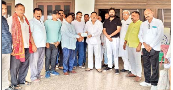
किष्की की बीमारी से त्रस्त मरीज को विधायक ने दिया एक लाख रुपये का चेक