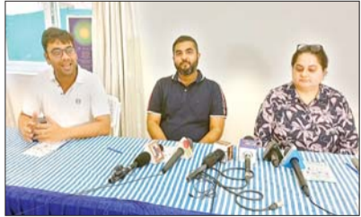
रांची (आजाद सिपाही)। योग विद्या प्राणिक हीलिंग झारखंड ट्रस्ट द्वारा इस वर्ष बुद्ध पूर्णिमा के अवसर पर मेडिटेशन शिविर का आयोजन रांची के