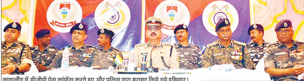
लावालौंग में डीजीपी प्रेस कॉन्फ्रेंस करते हुए और पुलिस द्वारा बरामद किये गये हथियार।