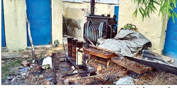
दुरभाष पर घटना कि सूचना दिया।