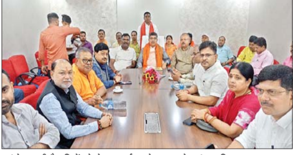
आंदोलन की तैयारियों को लेकर चर्चा करते भाजपा के सांसद, विधायक व अन्य।

भाजपा के वरिष्ठ नेताओं-विधायकों-पूर्व विधायकों ने बैठक कर बनाई रणनीति आजाद सिपाही संवाददाता