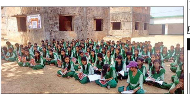
कार्यक्रम में उपस्थित स्कूली बच्चियां।