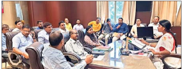
की टंकी स्थापित पर उपयोग में लाया जा सकता है। उन्होंने यह भी बताया कि फिहाल नगर निगम क्षेत्र में 80 जगहों पर टैंकर के माध्यम से जलापूर्ति की जा रही है। निगम क्षेत्र में कुल 69078 वैध वाटर कनेक्शन हैं। मेयर ने बताया कि निगम क्षेत्र में खासकर ड्राई जॉन क्षेत्र में आम लोगों को नियमित रूप से टैंकर के माध्यम से जलापूर्ति की जा रही है। इसके अलावा, मेयर, डिप्टी मेयर, सांसद, विधायक, नगर

आजाद सिपाही संवाददाता रांची। मेयर डॉ आशा लकड़ा ने बुधवार को रांची नगर निगम के स्वास्थ्य और जलापूर्ति शाखा की समीक्षा की। इस क्रम में उन्होंने विभागीय अधिकारियों में वाई स्तर पर पेयजल संकट की स्थिति और नगर निगम की ओर से की गयी व्यवस्था की जानकारी ली। मेयर ने बताया कि गर्मी के मौसम में जलसंकट की स्थिति से निपटने के लिए एक करोड़ रुपये की राशि उपलब्ध है। वर्तमान में रांची नगर निगम क्षेत्र में 2507 चापानल चालू स्थिति में हैं। खराब चापानलों की मरम्मत कराने के निर्देश दिये गये हैं। कुछ चापानल ऐसे हैं, जिसका उपयोग नहीं किया जा रहा है। इन चापानलों में मोटर लगा कर सिस्टम