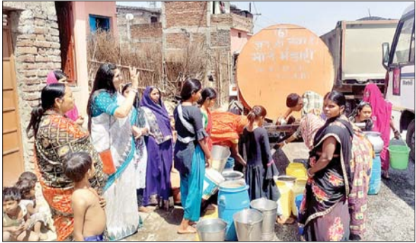
पानी की समस्या से जूझ रहे लोगों से बातें करते महापौर अरुणा शंकर।

मेदिनीनगर। नगर निगम की महापौर अरुणा शंकर ने बुधवार को खुद चैनपुर शाहपुर के वाडों में जाकर निगम की ओर से कराई जा रही टैंकर से जलापूर्ति का निरीक्षण किया। उन्होंने उपस्थित महिला-अलड़कियों को आश्वासन दिया कि वो लगातार निगम के सभी क्षेत्रों में जायगी और जहां भी पानी की समस्या होगी वहां तत्काल यथासंभव टैंकर से पानी बढ़ा कर दिया जाएगा। महापौर ने यह भी कहा कि अभी सभी वाडों में (1/2 वाड छोड़कर) पार्श्वों के माध्यम से पांच-पांच टैंकर पानी की आपूर्ति की जा रही है। जरूरत पड़ी तो और टैंकर बढ़ाए जाएंगे। महापौर ने कहा कि मेरी विशेष निगाह ड्राइव जोन (सूखे इलाके) में है। मैं खुद ड्राइव जोन में जाऊंगी