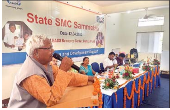
राज्य स्तरीय विद्यालय प्रबंधन समिति को संबोधित करते पद्मभूषण कड़िया मुंडा।