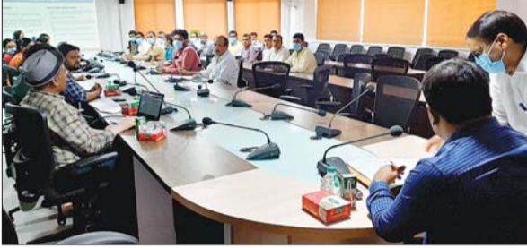
अभियान की तैयारियों को लेकर पदाधिकारियों के साथ बैठक करते पलामू डीसी ए दोड्डे।

मेदिनीनगर। पलामू जिले में 20 अप्रैल को राष्ट्रीय कृमि मुक्ति दिवस को लेकर विशेष अभियान चलाया जायेगा। इसके तहत एक से 19 साल तक के किशोर-किशोरियों को कृमि नाशक अल्बेंडाजोल की गोली खिलायी जाएगी। यह गोली जिले में सभी सरकारी व निजी विद्यालयों एवं सभी आंगनवाड़ी केंद्रों पर खिलायी जायेगी। उक्त बातें डीसी आंजनेयुलू दोड्डे ने कही। वे बुधवार को राष्ट्रीय कृमि मुक्ति दिवस की सफलता को लेकर आयोजित बैठक को संबोधित कर रहे थे। उन्होंने शिक्षा, स्वास्थ्य व