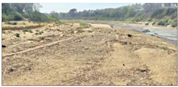
गर्मी के कारण सूख चुकी बचरा दामोदर नदी।

पिपरवार। सीसीएल पिपरवार कोयलांचल और आसपास के ग्रामीण इलाकों में भीषण और उमस भरी गर्मी से लोग बेहाल है। सुबह 9 बजे से लेकर शाम 5 बजे तक घर से बाहर निकलना मुश्किल हो गया है। जिस कारण चौक-चौराहों व बाजारों में सन्नाटा पसरा हुआ रहता है। कड़ी धूप के साथ चल रही लू ने लोगों को घरों में कैद कर रख दिया है। इधर, गर्मी से सबसे ज्यादा परेशानी स्कूलों बच्चों को रही है। सुबह स्कूल जाने में तो कोई दिक्कत नहीं हो रही है, लेकिन स्कूल से घर आने में पसीने छूट रहे हैं।