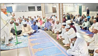
बचरा जामा मस्जिद के इमाम हाफिज

पिपरवार क्षेत्र के बचरा जामा मस्जिद में बुधवार की रात तरावीह की नमाज मुकमल हुई।