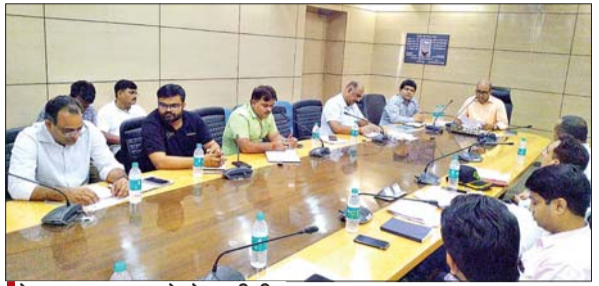
पेयजल समस्या को लेकर डीसी ने बीसीसीएल,टाटा सहित अन्य कंपनियों के साथ की बैठक

आजाद सिपाही संवाददाता धनबाद। गर्मी के दौरान जिले के विभिन्न क्षेत्रों में पेयजल आपूर्ति की समस्या के समाधान को लेकर डीसी सह जिला दंडाधिकारी सदीप सिंह ने बुधवार को समाहरणालय सभागार में बीसीसीएल, टाटा स्टील, मैथन पावर लिमिटेड, ईसीएल, हिंदुस्तान उर्वरक एवं रसायन लिमिटेड, एसीसी सहित अन्य कंपनियों के साथ बैठक की। जिसमें गर्मी के दौरान आपसी समन्वय बनाकर लोगों को पेयजल उपलब्ध कराने को लेकर चर्चा की। इस दौरान डीसी ने सभी कंपनियों से उनके क्षेत्र में आम लोगों को गर्मी के दौरान सुचारू जलापूर्ति किए जाने की समीक्षा की। जहां बीसीसीएल ने कहा कि वे गर्मी के दौरान अपने आसपास के क्षेत्रों में 49 ट्रक माउटेड टैंकर द्वारा पानी की आपूर्ति करते हैं। इसके अलावा विभिन्न क्षेत्रों में लगे 208 हैंडपंप से लोगों को पानी मिलता है। डीसी ने बीसीसीएल को आम जनों के लिए टैंकर की अलग व्यवस्था रखने, किस क्षेत्र में आमजन के लिए कितने टैंकर चलेंगे, उसकी विस्तृत सूची जिला प्रशासन को उपलब्ध कराने का निर्देश दिया। इसके अलावा सभी कंपनियों से विगत पांच वर्षों का सीएसआर एक्टिविटी रिपोर्ट उपलब्ध कराने तथा वित्तीय वर्ष 2023-24 का सीएसआर एक्शन प्लान भी तैयार करने को कहा। वहीं, एमपीएल प्रतिनिधि ने जानकारी देते हुए बताया कि वे आसपास के 21 गांव में तीन टैंकर से जलापूर्ति करते हैं। इसके अलावा कंपनी के 17 सोलर वाट, विस्तृत एक्टिविटी रिपोर्ट उपलब्ध कराने को कहा।