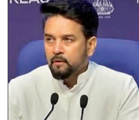
व्या है राष्ट्रीय क्वांटम मिशन? : विज्ञान एवं प्रौद्योगिकी मंत्री जितेंद्र सिंह ने बताया कि पिछले नौ वर्षों में प्रधानमंत्री नरेंद्र मोदी के नेतृत्व वाली सरकार ने कई क्रांतिकारी कार्य किए हैं। यह मिशन इस दिशा

नयी दिल्ली। प्रधानमंत्री नरेंद्र मोदी की अध्यक्षता में मंगलवार को केंद्रीय कैबिनेट की बैठक हुई। इसमें कई अहम निर्णय लिए गए। इस दौरान नेशनल क्वांटम मिशन को मंजूरी दी गई। केंद्रीय मंत्री अनुराग ठाकुर ने कहा कि नेशनल क्वांटम मिशन के लिए मंजूरी भी प्रधानमंत्री नरेंद्र मोदी की सरकार ने दी है। इसके लिए 6,003 करोड़ रुपये के बजट का प्रावधान किया गया है। 2023-24 से 2030-31 तक का इसकी समयसीमा है। इस दौरान सिनेमेटोग्राफ एक्ट 2023 पर भी बड़ा फैसला लिया गया। केंद्रीय मंत्री अनुराग ठाकुर ने कहा कि फिल्म जगत, कलाकारों और प्रशंसकों से जुड़ा हुआ निर्णय लिया गया है। बहुत समय से मांग थी कि पायरेसी पर कुछ किया जाए। आज कैबिनेट ने अनुमति दी है कि संसद के आने वाले सेशन में सिनेमेटोग्राफ एक्ट 2023 लाया जायेगा।