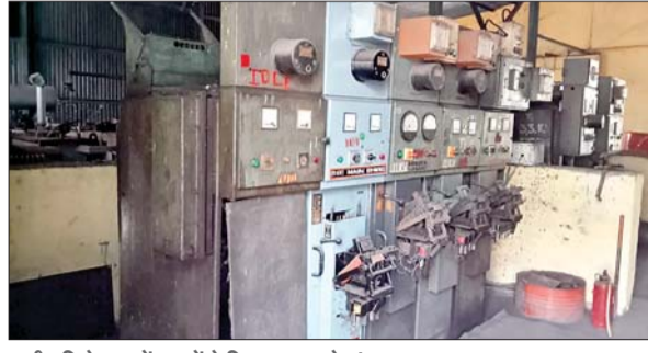
इसी परियोजना में लूटने में दिया घटना का अंजाम।