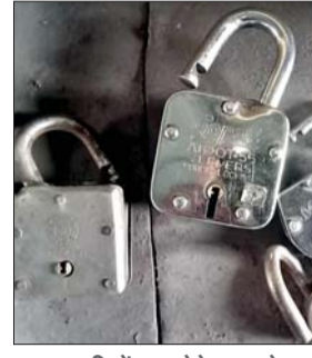
अपराधियों द्वारा लूटे गए ताले।