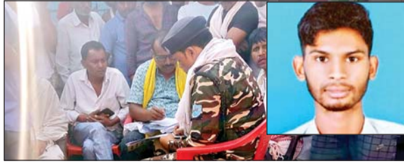
परिजनों का आरोप राजकुमार का किया गया हत्या, जांच में जुटी पुलिस