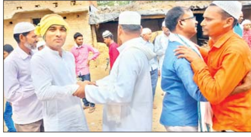
केतार में ईद की नमाज के बाद गले मिलते लोग