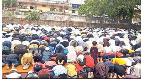
रंका में नमाज अदा करते लोग