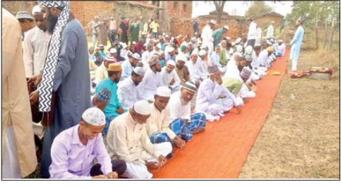
भंडरिया में ईद की नमाज अदा करते लोग