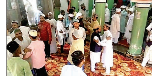
एक-दूसरे के गले मिलकर ईद की बधाई देते मुस्लिम समाज के लोग।