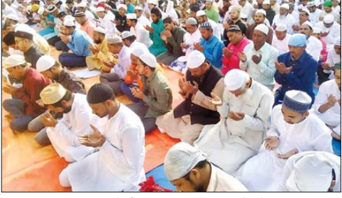
गढ़वा शहर में ईद की नमाज अदा करते लोग

गढ़वा। जिले में ईद-उल-फितर का त्योहार अकीदत व मसरत के साथ मनाया गया। इस मौके पर मुस्लिम समुदाय के लोगों ने स्थानीय इदगाहों, मस्जिदों व मदरसों में दो रिकअत वाजिब नमाज-ए-ईद - उल-फितर अदा की। नमाज अदायगी को लेकर मस्जिदों एवं इदगाह स्थलों पर सुह से ही नमाजियों की भीड़ जमा होने लगी थी। नमाज अदा करने के बाद लोग एक-दूसरे से गले मिलकर ईद-उल-फितर की बधाई दी। जिला मुख्यालय स्थित गढ़वा इदगाह में जामा मस्जिद के पेश इमाम हाफिज अब्दुसमद के