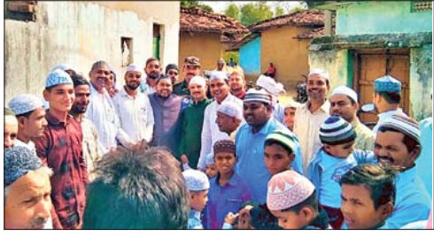
कांडी में ईद की नमाज के बाद एक-दूसरे को बधाई देते लोग