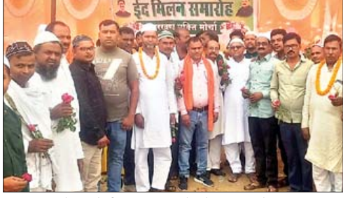
भेराल में ईद मिलन समारोह में शामिल लोग