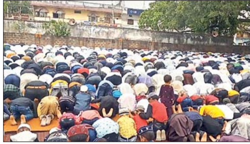
रंका में नमाज अदा करते लोग