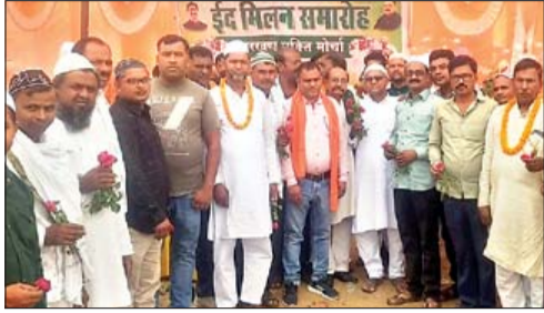
भेराल में ईद मिलन समारोह में शामिल लोग