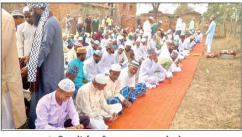
भंडरिया में ईद की नमाज अदा करते लोग