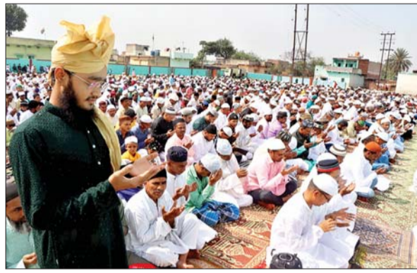
धनबाद कोयलांचल के विभिन्न जगहों पर ईद उल फितर के अवसर पर नमाद अदा कर क्षेत्र, समाज, राज्य व देश में अमन-चैन और भाइचारे की दुआ मांगते लोग।

धनबाद। कोयलांचल में शनिवार को पूरे शांति और सौहार्दपूर्ण माहौल में ईद का त्योहार मनाया गया। सुबह से ही लोग अपने-अपने घरों के आसपास के मस्जिदों और ईदगाहों में ईद की नमाज अदा करने निकल पड़े। नमाज के बाद देश में अमन चैन व तरक्की के लिए दुआ मांगी गई। वहीं सभी जगह मस्जिद और ईदगाहों में नमाज पढ़ाने वाले इमामों ने त्योहार को शांति, प्रेम और भाईचारे के बीच मनाने की अपील की, ताकि यहां की गंगा जमुनी तहजीब बनी रहे। नमाज के उपरांत सभी ने एक-दूसरे से गले मिलकर ईद की शुभकामनाएं व बधाई दी। धनबाद, झरिया, सिंदरी,