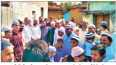
कांडी में ईद की नमाज के बाद एक-दूसरे को बधाई देते लोग