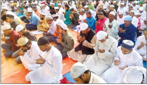
गढ़वा शहर में ईद की नमाज अदा करते लोग

गढ़वा। जिले में ईद-उल-फितर का त्योहार अकीदत व मसरत के साथ मनाया गया। इस मौके पर मुस्लिम समुदाय के लोगों ने स्थानीय इदगाहों, मस्जिदों व मदरसों में दो रिकअत वाजिब नमाज-ए-ईद - उल-फितर अदा की। नमाज अदायगी को लेकर मस्जिदों एवं इदगाह स्थलों पर सुह से ही नमाजियों की भीड़ जमा होने लगी थी। नमाज अदा करने के बाद लोग एक-दूसरे से गले मिलकर ईद-उल-फितर की बधाई दी। जिला मुख्यालय स्थित गढ़वा इदगाह में जामा मस्जिद के पेश इमाम हाफिज अब्दुसमद के