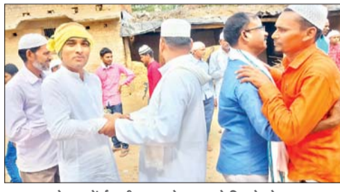
केतार में ईद की नमाज के बाद गले मिलते लोग