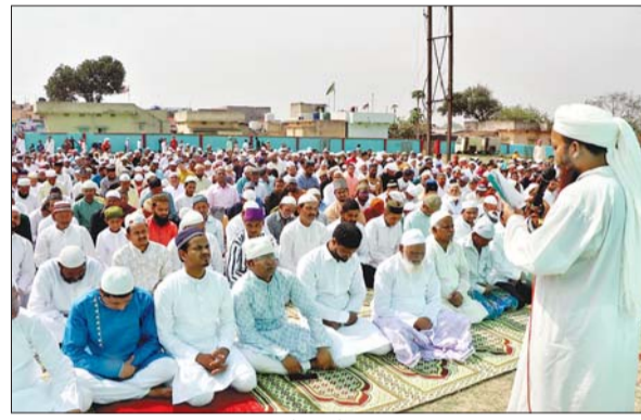
धनबाद कोयलांचल के विभिन्न जगहों पर ईद उल फितर के अवसर पर नमाद अदा कर क्षेत्र, समाज, राज्य व देश में अमन-चैन और भाइचारे की दुआ मांगते लोग।

ईद को लेकर जिले के सभी मुस्लिम बहुल क्षेत्रों में खासा उत्साह दिखा। विशेष कर रमजान के पूरे महीने रोजा रखने वाले रोजेदारों और बच्चों के चेहरे पर त्योहार की खुशियां साफ झलक रही थीं। वहीं कई जगह ईदगाहों के समीप छोटे-छोटे मेले का भी