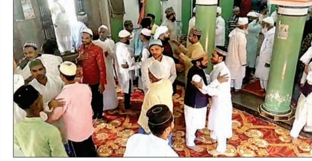
एक-दूसरे के गले मिलकर ईद की बधाई देते मुस्लिम समाज के लोग।