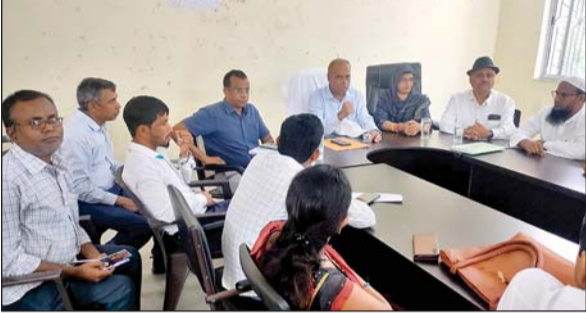
श्रमदान कर हम वर्षा के पानी को रोक सकते हैं केवल संकल्पित भाव से काम करने की आवश्यकता है। इसके बाद विष्णुगढ़ अखाड़ा चौक में स्थित विष्णुगढ़ विकास ट्रस्ट के द्वारा आयोजित अम्बिसन पब्लिक स्कूल में जागरूकता कार्यक्रम में उन्होंने स्लाइड के माध्यम से अपनी मांडल को लोगों के बीच प्रस्तुत कर प्रेरित किया। उन्होंने