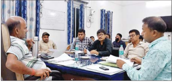
प्रबंधन के साथ बैठक करते एनसीओइए (सीटू) के सदस्य।