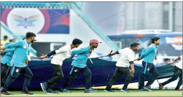
बारिश से पिच को बचाने की कोशिश करते स्टेडियम के कर्मचारी।

लखनऊ। चेन्नई सुपर किंग्स और लखनऊ सुपरजायंट्स के बीच इंडियन प्रीमियर लीग (आइपीएल) 2023 का 45वां मुक़ाबला बुधवार को बारिश के कारण रद्द कर दिया गया। यह इस सीजन का पहला मुक़ाबला है, जो बारिश के कारण रद्द हुआ है। जबकि टूर्नामेंट के इतिहास में यह छठा मैच है, जो बेनतीजा रहा है। 249 मैचों के बाद इस लीग का कोई मैच नो रिजल्ट रहा है। इससे पहले, 30 अप्रैल 2019 को बंगलुरु में आरसीबी और राजस्थान रॉयल्स (आरआर) के बीच बारिश के कारण मैच रद्द