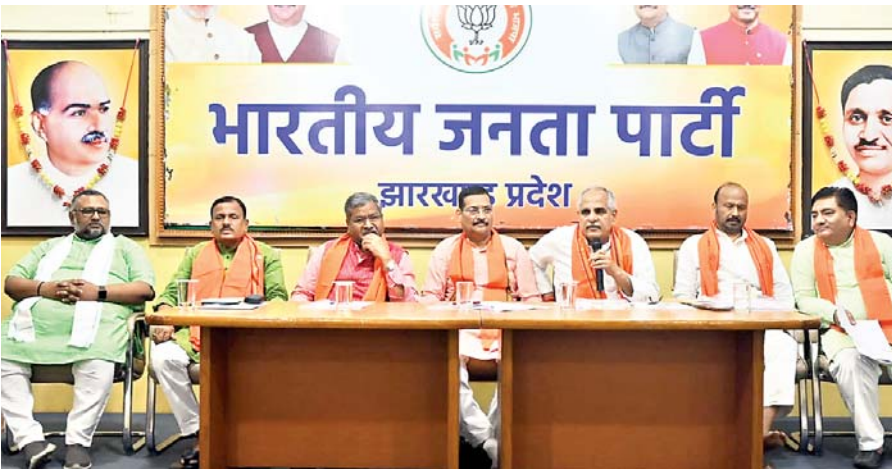
सबका साथ, सबका विकास पार्टी का मंत्र: बाबूलाल मरांडी नेता विधायक दल एवं पूर्व