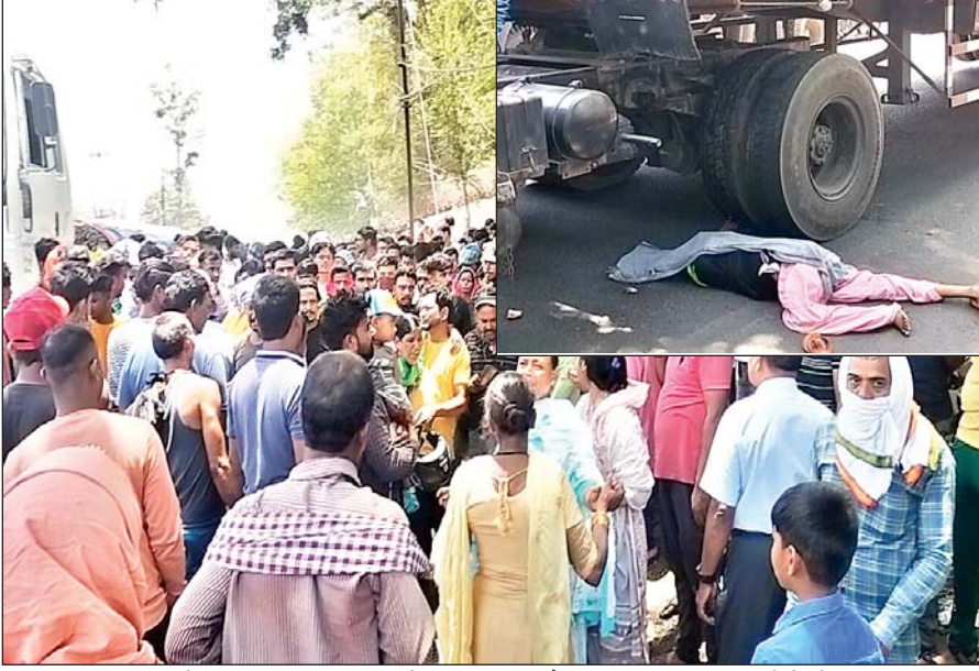
पुलिस प्रशासन के खिलाफ जमकर नारेबाजी की। इधर, घटना की सूचना पाकर रामगढ़ थाना

रामगढ़। शहर के नई सराय स्थित डीवीसी के निकट बुधवार को सरिया लदा ट्रेलर संख्या बीआर 02 जीए 8837 ने बाइक संख्या जेएच 01डीएम 6802 पर सवार एक परिवार को जोरदार टक्कर मार दी। जिससे बाइक में सवार महिला सड़क के बीचों बीच गिर गई। इसी बीच पीछे से आ रही सरिया लदा ट्रेलर ने अपनी चपेट में लिया लिया। जिससे महिला की मौत मौके पर ही हो गई। जबकि बाइक में सवार उसका पति और डेढ़ साल का बच्चा घायल हो गया। जिसे स्थानीय लोगों ने नई सराय सीसीएल अस्पताल में भर्ती कराया। दुर्घटना के बाद स्थानीय लोगों ने सड़क जाम कर दिया और जमकर बवाल काटा। आक्रोशित भीड़ ने पथराव कर ट्रक के शीशे तोड़ डाले और