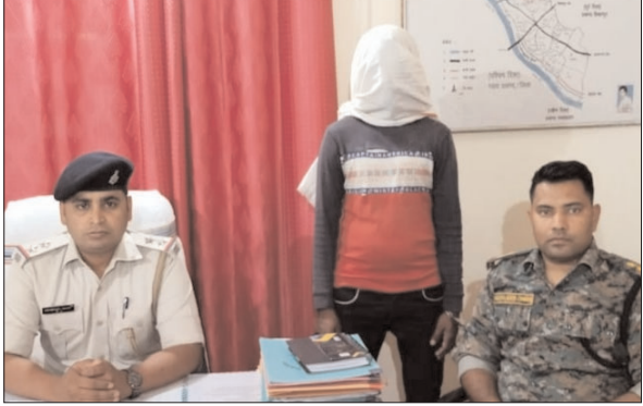
गिरफ्तार आरोपित की जानकारी देती पुलिस।