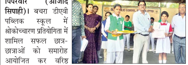
पिपरवार (आजाद सिपाही)।

बचरा डीएवी पब्लिक स्कूल में श्लोकच्यारण प्रतियोगिता में शामिल सफल छात्र-छात्राओं को समारोह आयोजित कर वरिष्ठ