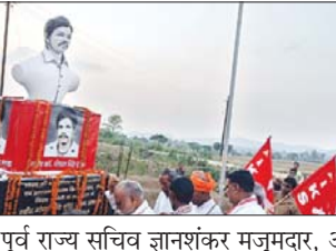
राहे (आजाद सिपाही)।