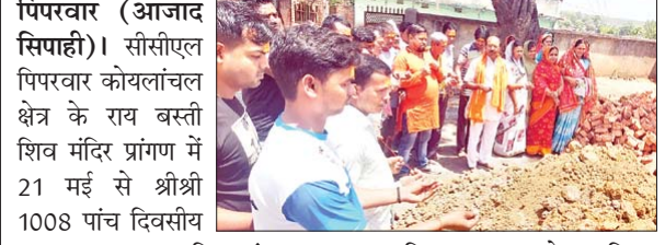
पिपरवार (आजाद सिपाही)।