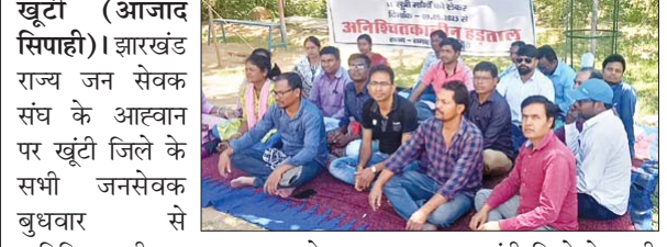
खूंटी ।