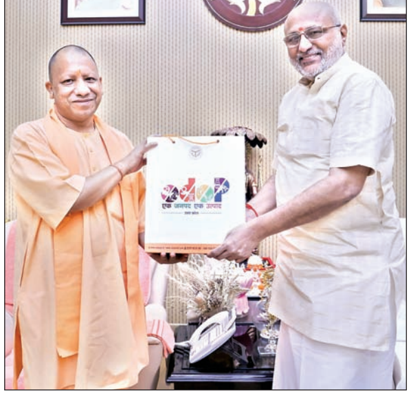
झारखंड के राज्यपाल सीपी राधाकृष्णन ने 18 मई गुरुवार को उत्तर प्रदेश के मुख्यमंत्री योगी आदिदत्तनाथ से लखनऊ स्थित मुख्यमंत्री आवास में मुलाकात की। बताया जा रहा है कि यह शिष्टाचार भेंट थी।