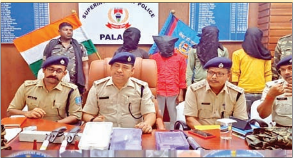
पकड़े गए आरोपितों की जानकारी देते एसपी, एसडीपीओ व अन्य।

इसकी सूचना तुरंत पुलिस को नहीं दी थी। देर से सूचना के बाद भी पुलिस टीम बना कर छापामारी की गयी। अमानत नदी किनारे छह