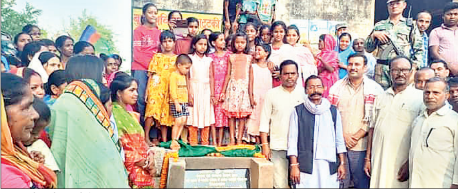
जलापूर्ति निर्माण कार्य योजना का शिलान्यास करते सिल्ली विधायक सुदेश महतो व अन्य।

आजाद सिपाही संवाददाता राहे। प्रखंड के नावाडीह गांव में पांच करोड़ रुपये की लागत से बनने वाले ग्रामीण जलापूर्ति निर्माण कार्य का शिलान्यास विधायक सुदेश महतो ने किया। बताते चलें कि नावाडीह पंचायत के 1644 परिवार को पाइप लाइन की मदद से घर-घर तक शुद्ध पेयजल पहुंचाने का लक्ष्य निर्धारित किया गया है। योजना में 37 बोरिंग किया जायेगा। वहीं, शिलान्यास समारोह के दौरान अपने संबोधन में विधायक सुदेश