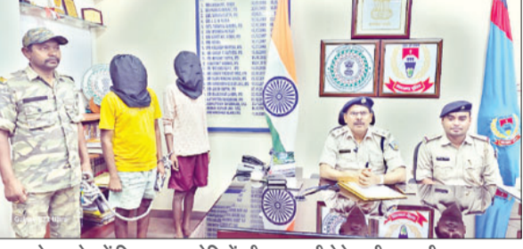
हत्या के आरोप में गिरफ्तार आरोपितों की जानकारी देते ग्रामीण एसपी व अन्य।