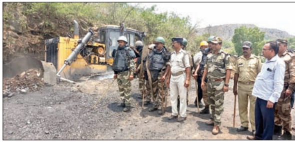
माईंस का संचालन हो रहा था।

अवैध उत्खनन को देख अचंभित हो गए। संयुक्त टीम ने अवैध उत्खनन स्थल से कोयला जब्त कर लाने में असमर्थ थी इसलिए टीम ने उत्खनन स्थल पर ही अवैध कोयला को मुहाने के अंदर मिट्टी और पत्थर से दबा दिया। एक बीसीसीएल अधिकारी ने अवैध धंधेबाज की माईंस को देखकर दबी जुबान से कहा कि जरूर इनके साथ अंडरग्राउंड में काम करने में सक्षम व्यक्ति का सहयोग प्राप्त है। तभी इतनी अच्छे तरीका से अवैध