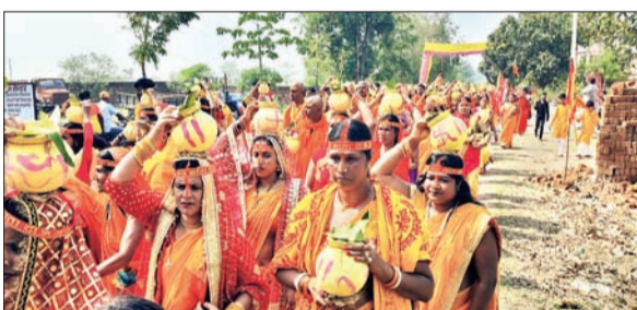
कलश यात्रा में शामिल श्रद्धालु महिलाएं।