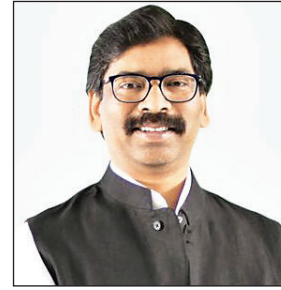
रणनीतियों पर चर्चा की थी। सूत्रों की मानें तो इस विपक्षी एकजुटता का सीएम हेमंत सोरेन समर्थन कर रहे हैं। 20 विपक्षी दल रहे शामिल : 12 जून को पटना में नीतीश कुमार की ओर से आयोजित विपक्षी दलों की बैठक में देश भर से 20 विपक्षी

होंगे। बैठक में सीएम हेमंत सोरेन झामुमो की ओर से शामिल होंगे। उन्होंने इसके लिए अपनी सहमति दे दी है। रणनीति पर चर्चा है चर्चा : बता दें कि देश भर में विपक्षी पार्टियों को एकजुट करने को लेकर बिहार के सीएम नीतीश कुमार पिछले कुछ महीनों से विभिन्न राज्यों में जाकर समर्थन मांग रहे हैं। इस क्रम में वह रांची आकर सीएम हेमंत सोरेन से मिले थे। इस मुलाकात में उन्होंने सीएम हेमंत सोरेन को अपनी मुहिम से अवगत कराया था। इस दौरान सीएम हेमंत सोरेन ने उनके साथ पूरी विपक्षी एकता की