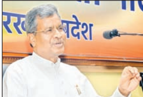
आयोग। इसका काम कायदे से उन बच्चों के हित में काम करना है, जिन्हें सुरक्षा की आवश्यकता है लेकिन आयोग से दो लोग अध्यक्ष और एक सदस्य एक के बाद एक रांची के सभी प्रतिष्ठित स्कूल में जा रहे हैं। वे ऐसे स्कूलों में जा रहे हैं, जहां पहले से ही बच्चे सुरक्षित हैं। ऐसे प्रतिष्ठित स्कूलों में जाने का

आजाद सिपाही संवाददाता रांची। भाजपा विधायक दल के नेता बाबूलाल मरांडी ने झारखंड राज्य बाल अधिकार संरक्षण आयोग के अध्यक्ष और एक सदस्य की भूमिका को लेकर सवाल उठाया है। उन्होंने मुख्यमंत्री हेमंत सोरेन का भी ध्यान आकृष्ट कराते हुए आयोग के रवैये से सरकार की बदनामी होने की बात कही है। सोशल मीडिया के माध्यम से बाबूलाल ने बुधवार को कहा कि झारखंड में एक ही आयोग का अब तक गठन हुआ है- झारखंड राज्य बाल अधिकार संरक्षण