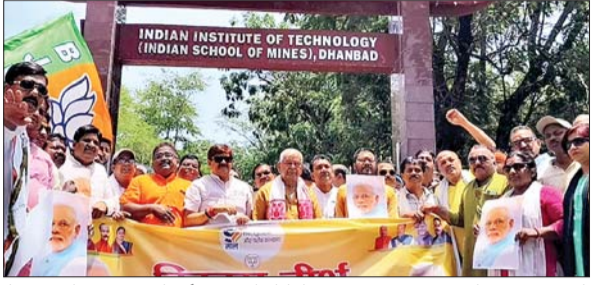
केंद्र की मोदी सरकार के नौ साल पूरे होने के अवसर पर शुक्रवार को भाजपा की ओर से निकाली जा रही विकास तीर्थ रैली में शामिल सांसद-विधायक व अन्य कार्यकर्ता।