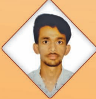
Kaushal IIT (Kharagpur)