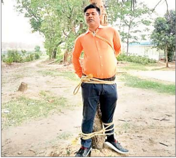
आरोपित अफसर को पेड़ से बांध कर की गयी पिटाई।

कांके। बिरसा कृषि विश्वविद्यालय के वानिकी कॉलेज के बहरा डिप्टा में कैजुअल मजदूर के रूप में काम कर रही एक नाबालिग लड़की के साथ नाहेफ प्रोजेक्ट के तहत कार्य करने वाले एक अधिकारी द्वारा दुष्कर्म किए जाने का मामला प्रकाश में आया है। घटना सोमवार की दोपहर तीन बजे की बतायी जा रही है। नाबालिका से दुष्कर्म के आरोपित अफसर नाहेफ प्रोजेक्ट के सबसे बड़े अफसर का नजदीकी बताया जाता है। दूसरी ओर, घटना की जानकारी मिलते ही कैजुअल मजदूरों ने मंगलवार को आरोपित अफसर को पेड़ से बांधकर उसकी जमकर पिटाई कर दी। हालांकि समाचार लिखे जाने तक घटना की शिकायत कांके थाना में दर्ज नहीं करायी