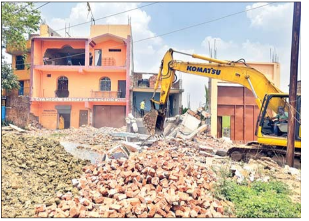
नगड़ी प्रशासन की ओर से जेसीबी मशीन से पिस्का में हटाया जा रहा अतिक्रमण।