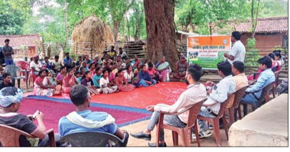
शिविर लगाकर किसानों को जागरूक करते जिला कृषि विभाग के सदस्य।