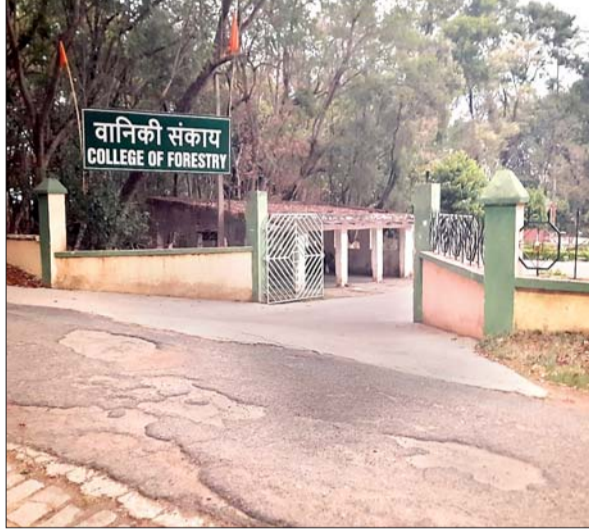
कॉलेज ऑफ फॉरेस्ट्री की फाइल फोटो।

नौकरी खतरे में पड़ सकती है। सूत्रों की मानें तो पीड़िता की मां बीमार है। वह अपनी बीमार मां की जगह ही मजदूरी करने फॉरेस्ट्री कॉलेज जाती है। विश्वसनिय सूत्रों का यह भी