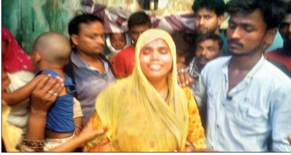
आपस में झगड़ रहे बसपा और राकांपा कार्यकर्ताओं को समझा-बुझा कर शांत कराने की कोशिश करती पुलिस। रोती बिलखती मृतक युवक की पत्नी।