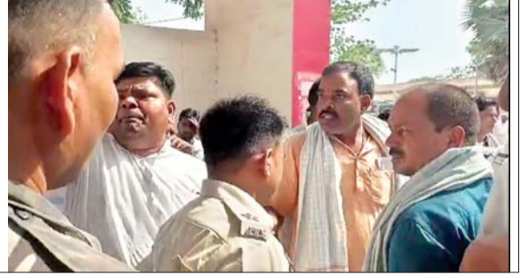
आपस में झगड़ रहे बसपा और राकांपा कार्यकर्ताओं को समझा-बुझा कर शांत कराने की कोशिश करती पुलिस। रोती बिलखती मृतक युवक की पत्नी।