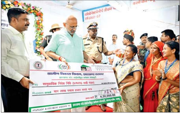
स्वयं सहायता समूह की महिलाओं को चेक प्रदान करते राज्यपाल सीपी राधाकृष्णन।

मेदिनीनगर। राज्यपाल सीपी राधाकृष्णन ने पलामू जिले के रामगढ़ प्रखंड अंतर्गत नावाडीह पंचायत भवन में सुरंगाही टोला के ग्रामीणों के साथ संवाद किया। कहा कि जब तक आदिम जनजाति का विकास नहीं होगा, राज्य का विकास नहीं होगा। केंद्र एवं राज्य सरकार की ओर से आप सबके के उत्थान के लिए कई योजनाएं चलाई जा रही हैं। आप सभी को इन योजनाओं का लाभ उठाना चाहिए। उन्होंने कहा कि पलामू प्रमंडल आने से पूर्व स्कूली शिक्षा एवं साक्षरता सचिव और उच्च एवं तकनीकी शिक्षा सचिव के साथ समीक्षा की थी। विद्यालय में शिक्षकों एवं अस्पताल में चिकित्सकों की कमी व अनुपस्थिति पर संज्ञान लेते हुए उन्होंने कहा कि राज्य के सभी विद्यालयों में बायोमेट्रिक उपस्थिति के साथ अस्पताल में चिकित्सकों की भी