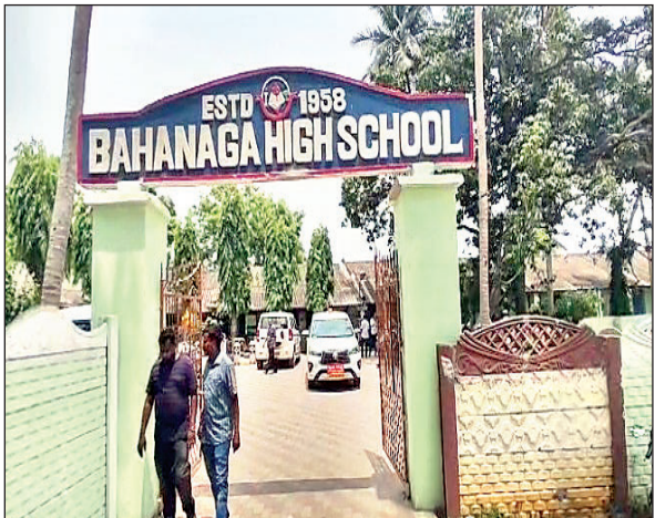
स्कूल भवन के दो कमरों और बचाल दालान को अस्थायी मुर्दाघर में बदल दिया था। यहाँ कफन में लिपटे शवों को लाया गया था।

आजाद सिपाही संवाददाता भुवनेश्वर। ओड़िशा ट्रेन हादसे में जान गंवाने वालों के शवों को स्कूल के जिस भवन में रखा गया था, उसे अब गिराया जा रहा है। स्कूल प्रशासन का कहना है कि बच्चे और टीचर्स यहाँ आने से डर रहे थे, इसलिए बिल्डिंग को गिराकर फिर बनाने का निर्णय लिया गया है। स्कूल खुलने से पहले इसका शुद्धीकरण भी कराया जायेगा। बालासोर में 2 जून को हुए ट्रेन हादसे में 288 लोगों की मौत हुई थी। शवों को घटनास्थल से 500 मीटर दूर बहानगा हाईस्कूल में रखा गया था। राहत-बचाव टीम ने 65 साल पुराने