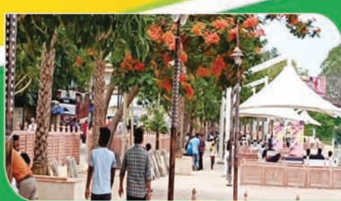
कोयल रिवर फ्रंट निगम वासियों को समर्पित