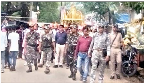
बुंदू में रथयात्रा में शामिल लोग