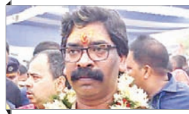
भगवान जगन्नाथ सभी राज्यवासियों पर कृपा बनाये रखें। आप सभी स्वस्थ, सुखी और समृद्ध रहें, यही कामना करता हूँ - हेमंत सोरेन, मुख्यमंत्री

जयकारों से जगन्नाथपुर मेला परिसर गुंज उठा।