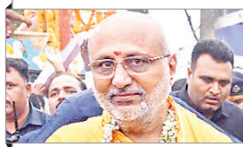
भगवान जगन्नाथ राज्यवासियों के जीवन में सुख, शांति और समृद्धि प्रदान करें। साथ ही सभी की मनोकामनाएं पूर्ण करें - सीपी राधाकृष्णन, राज्यपाल