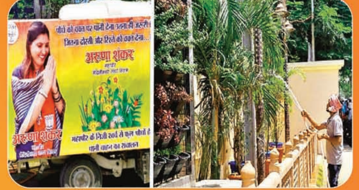
महापौर के निजी खर्च से पेड़ पौधों की सिंचाई की व्यवस्था

8 साल पूरा होने पर आजाद सिपाही परिवार को हार्दिक शुभकामनाएं