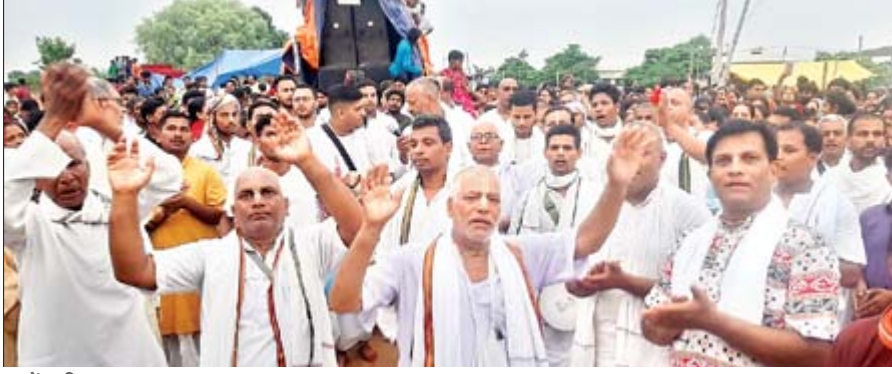
खूँटी और तोरपा में रथ यात्रा में शामिल श्रद्धालु