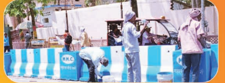
गांधी मार्ग (कचहरी रोड) का बदलता तस्वीर

पांच वर्ष सेवा का अवसर देने के लिए जन-जन का आभार