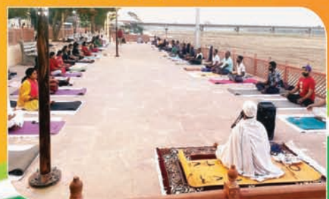
नवनिर्मित मरीन ड्राइव में योगाभ्यास करते लोग