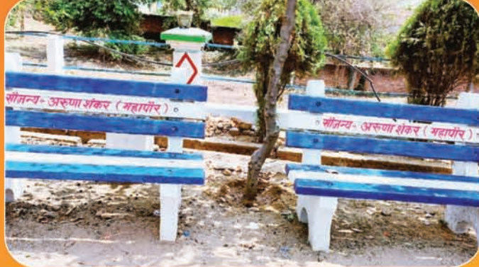
प्रथम महापौर के निजी खर्च से कई जगहों पर बैठने की व्यवस्था

8 साल पूरा होने पर आजाद सिपाही परिवार को हार्दिक शुभकामनाएं