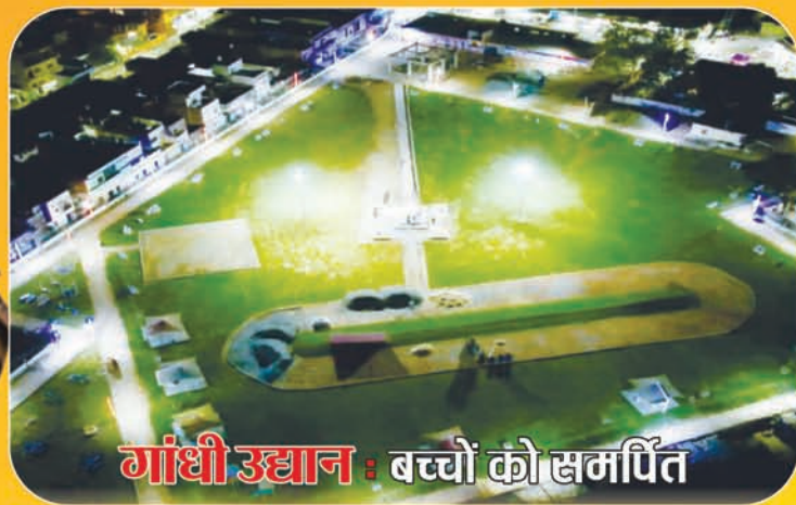
गांधी उद्यान : बच्चों को समर्पित

पांच वर्ष सेवा का अवसर देने के लिए जन-जन का आभार