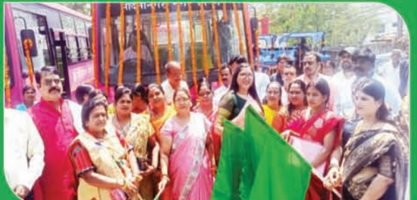
मात्र 5 रथया किराये पर महिलाओं को पिक सिटी बस समर्पित