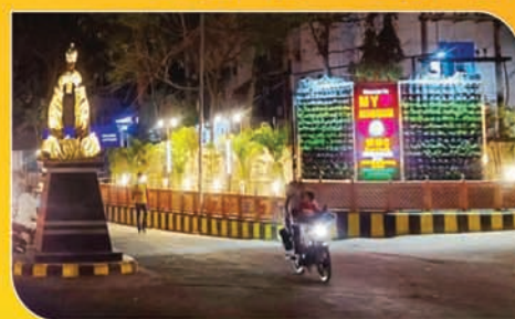
शहर में सजते चौक-चौराहे