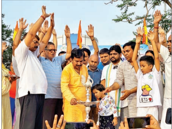
मेदिनीनगर (आजाद सिपाही)। अंतरराष्ट्रीय योग दिवस पर बुधवार को शिवाजी मैदान में सामूहिक योगाभ्यास किया गया।