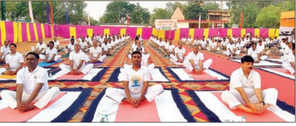
अंतरराष्ट्रीय योग दिवस पर सामूहिक योग करते अधिकारी-पदाधिकारी व अन्य।

'हां मैंने योग को अपने जीवन में शामिल कर लिया है' की थीम पर बना सेल्फी प्वाइंट रहा आकर्षण का केंद्र