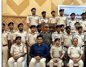
2011, झारखंड प्रोटेक्शन रूल्स 2015 एवं इवज एक्ट 2019 पर चर्चा की गई एवं इससे संबंधित जानकारीयां दी गईं। कार्यक्रम में आरबीआइ के शिकायत निवारण तंत्र यथा एकीकृत लोकपाल एवं सचेत पोर्टल के बारे में भी बताया गया। कार्यक्रम में आरबीआइ से

मेदिनीनगर (आजाद सिपाही)। रांची आरबीआइ के तत्वावधान में होटल रमाडा में पुलिस अधिकारियों के संवेदीकरण के लिए गुरुवार को एक कार्यक्रम का आयोजन किया गया। जिसका उद्देश्य जिले के पुलिस अधिकारियों को गैर निगमित इकाइयों द्वारा अनधिकृत डिपॉजिटर्स के मामले, वित्तीय धोखाधड़ी एवं उनके कार्यविधि एवं उनसे संबंधित कानूनी प्रावधानों से अवगत कराना था। कार्यक्रम में खासतौर पर झारखंड प्रोटेक्शन ऑफ डिपॉजिटर्स एक्ट