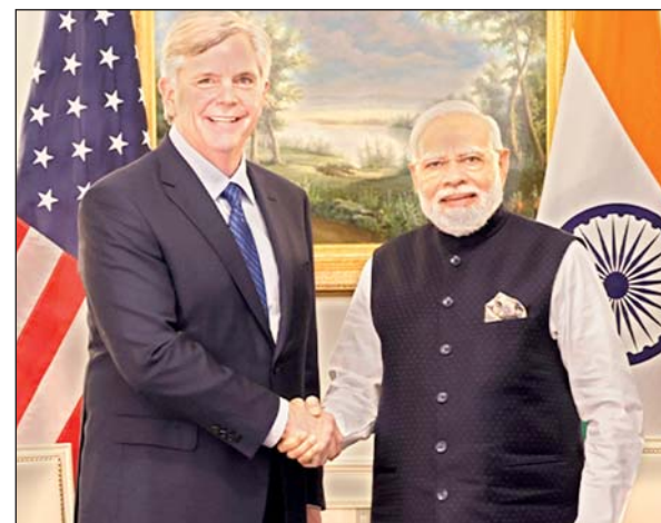
पीएम मोदी और बाइडेन जून सोदे की घोषणा करेंगे

एजेंसी वाशिंगटन। अमेरिका की जीई एयरोस्पेस और हिंदुस्तान एयरोनॉटिक्स लिमिटेड (एचएएल) के बीच फाइटर प्लेन (एफ 414) के इंजन बनाने का समझौता हो गया है। इसके तहत अब भारतीय लड़ाकू विमानों के इंजन भारत में ही बनेंगे। पहले जीई इन्हें सप्लाय करती थी। जीई ने प्रधानमंत्री नरेंद्र मोदी के अमेरिका दौरे के समय हुए इस समझौते को ऐतिहासिक बताया है। उधर, न्यूज एजेंसी के मुताबिक राष्ट्रपति जो बाइडेन और प्रधानमंत्री नरेंद्र मोदी के साझा बयान में भारत को हथियारबंद ज़ोन बेचे जाने की घोषणा होगी।