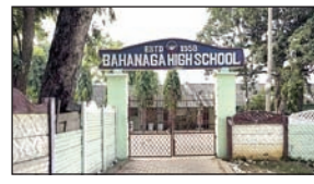
कोष से मंजूर की गयी है। गौरतलब है कि बीते दिन बाहानगा रेलवे स्टेशन पर हुए

भुवनेश्वर। बालेश्वर जिले के बाहानगा हाइस्कूल का 5टी परियोजनाओं में नवीनीकरण किया जायेगा। इसके लिए मुख्यमंत्री नवीन पटनायक ने दो करोड़ 49 लाख रुपये मंजूर किये हैं। यह धनराशि मुख्यमंत्री राहत