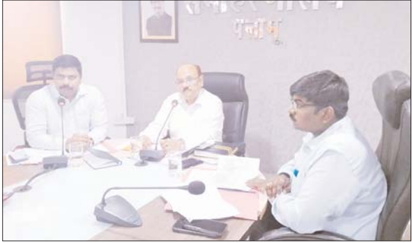
पलामू साहारणालय में अधिकारियों के साथ बैठक करते प्रमंडलीय आयुक्त।

प्रमंडलीय आयुक्त ने पलामू जिले में किसान क्रेडिट कार्ड एवं सीएम पशुधन विकास योजना की प्रगति की समीक्षा की आजाद सिपाही संवाददाता