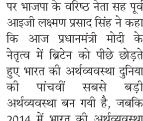
वहीं मोदी जी की सरकार के महज नौ वर्षों के दौरान 74 एयरपोर्ट बने। वहीं मोदी सरकार के नौ वर्षों

गिरिडीह। गिरिडीह के झंडा मैदान में आयोजित विशाल जनसभा को भाजपा के राष्ट्रीय अध्यक्ष जेपी नड्डा ने संबोधित किया। इस कार्यक्रम में धनवार विधानसभा क्षेत्र के गावा तीसरी, मालडा, पिहरा, धनवार आदि विभिन्न क्षेत्र के दर्जनों गांव से हजारों की संख्या में लोग कार्यक्रम में अपनी उपस्थिति दर्ज करायी। इस मौके