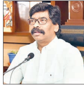
कार्यक्रम में शामिल होने के

देवघर। मुख्यमंत्री हेमंत सोरेन खराब मौसम के कारण मंगलवार को देवघर नहीं पहुंच पाये। देवघर में मुख्यमंत्री को 524 करोड़ की लागत से सिकटिया मेगा लिफ्ट एरिगेशन योजना का शिलान्यास करना था, लेकिन खराब मौसम के कारण मुख्यमंत्री का हेलीकॉप्टर रांची से उड़ान नहीं भर पाया। इस कारण शिलान्यास कार्यक्रम को रद्द