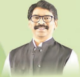
हेमंत सोरेन जिन्दाबाद

400 करोड़ की 400 योजनाएं गढ़वा की धरती पर लाने के साथ-साथ मंत्री ने दिखाया अपना नया रूप