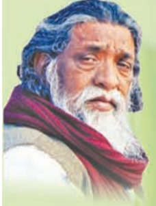
शिबू सोरेन जिन्दाबाद