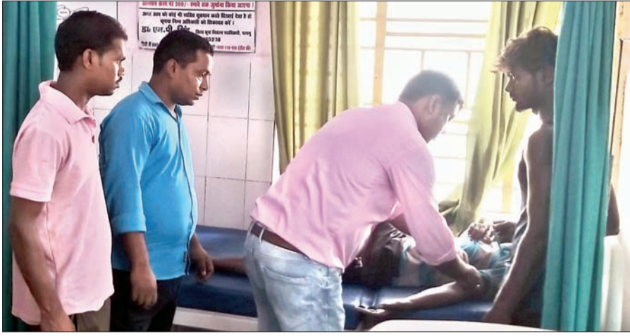
जांच करती चिकित्सकीय टीम।