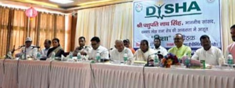
दिशा की बैठक में उपस्थित, सांसद, विधायक, डीसी-एसपी व अन्य।

सुखाइ, पेयजल एवं स्वच्छता, वन प्रमंडल, लघु सिंचाई, खाद्य आपूर्ति, बांध प्रबंधन, शिक्षा विभाग, कल्याण विभाग समेत 30 बिंदुओं पर की गई समीक्षा