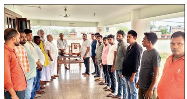
राम विलास पासवान की तस्वीर पर माल्यार्पण कर नमन करते एनसीपी कार्यकर्ता।