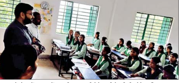
छात्रों से बातें कर उन्हें जरूरी जानकारी देते खूंटी के डीसी लोकेश मिश्रा।

खूंटी। डीसी लोकेश मिश्र ने शुक्रवार को रनिया प्रखंड का दौरा कर कार्यालय, स्कूल और अस्पताल का निरीक्षण किया। उन्होंने प्रखंड कार्यालय परिसर की साफ-सफाई करने का निर्देश दिया। डीसी ने कहा कि रनिया के ग्रामीण क्षेत्रों के लोग जानकारी के अभाव में योजनाओं के लाभ से वंचित न रहें। ग्रामीणों को अधिक से अधिक लाभांशित करने के लिए उन्हें योजनाओं से जोड़ना महत्वपूर्ण है। उन्होंने योजनाओं के प्रगति की जानकारी ली और ग्रामीणों की समस्याओं का निराकरण करने व उनसे निरंतर संपर्क बनाये रखने का निर्देश दिया। सामुदायिक स्वास्थ्य केंद्र के निरीक्षण के क्रम में उपलब्ध कराई जा रही स्वास्थ्य व्यवस्थाओं का भी जायजा लिया। डीसी ने निर्देश दिया कि आमजनों की सुविधा के