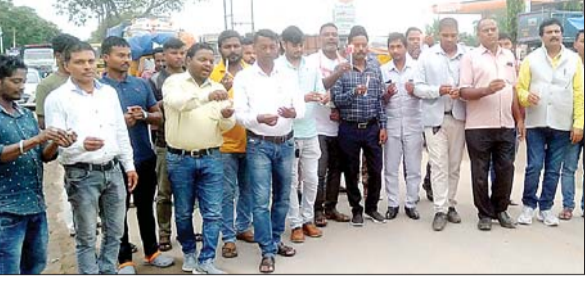
कैंडल मार्च निकाल कर न्याय की मांग करते लोग।