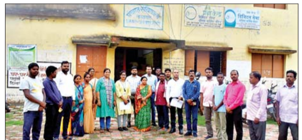
नवागढ़ पहुंचे पंचायती राज विभाग के पदाधिकारी व अन्य।

पंचायती राज्य विभाग के डीपीएम केरल पंचायती राज्य विभाग प्रतिनिधि के साथ पहुंचे नवागढ़ आजाद सिपाही संवाददाता