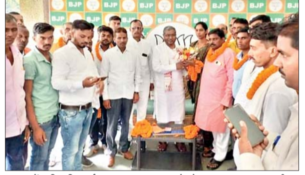
भाजपा में शामिल जिला पार्षद व अन्य का स्वागत करते प्रदेश अध्यक्ष बाबूलाल मरांडी।

भाजपा के प्रदेश अध्यक्ष बाबूलाल मरांडी ने सभी का पार्टी में किया स्वागत, अंगवस्त्र देकर किया सम्मानित आजाद सिपाही संवाददाता