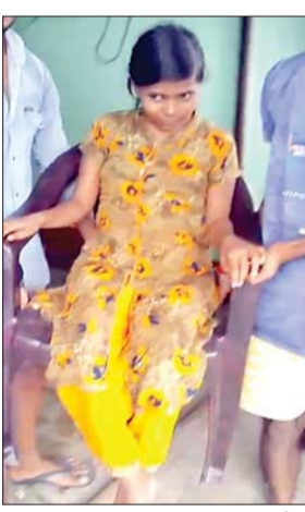
एक व्हीलचेयर नहीं मिल पाया है। इस संबंध में उन्होंने स्थानीय