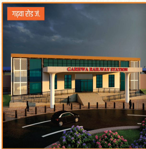
गढ़वा रोड जं.