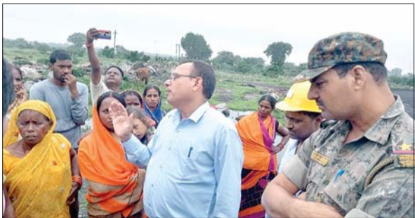
नाराज ग्रामीणों को समझाने का प्रयास करते अधिकारी।

आजाद सिपाही संवाददाता कतरास। बाघमारा थाना क्षेत्र के बीसीसीएल ब्लॉक-2 एरिया अंतर्गत अग्नि प्रभावित सिद्धपोकी बस्ती में भू-धंसान से बने दरारों की भराई करने पहुंचे अधिकारियों की संयुक्त टीम को ग्रामीणों ने काम ही नहीं करने दिया। ग्रामीणों के विरोध के कारण उन्हें बैरंग लौटना पड़ा। जानकारी के मुताबिक झरिया मास्टर प्लान के तहत पुलिस प्रशासन की मौजूदगी में शनिवार को अग्नि प्रभावित भू-धंसान क्षेत्र सिद्धपोकी बस्ती में दारारों की भराई करने गये ब्लॉक-टू क्षेत्र के अधिकारियों की संयुक्त टीम पहुंची थी। जिन्हें देख ग्रामीणों की भीड़ जुट गई। अधिकारियों की टीम ने ग्रामीणों को बताया कि बस्ती के लोगों को सुरक्षित पुनर्वास कराने को लेकर