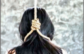
: परिवार के सदस्यों के अनुसार, उन्होंने उसे शनिवार रात 10 बजे देखा था। इसके बाद लड़की सोने के लिए कमरे में चली गईं। परिवार ने यह सोचकर सुबह जल्दी दरवाजा नहीं खटखटाया कि