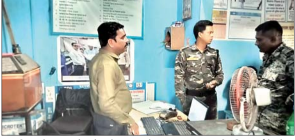
एसबीआई के ग्राहक सेवा केंद्र में लूटपाट के बाद पूछताछ करती पुलिस। मौके से बरामद कारतूस का खोखा। डकैतों की पिटाई से पीड़ित महिला।

कतरास। कतरास थाना क्षेत्र के कंचनपुर पंचायत के रामपुर स्थित एसबीआई ग्राहक सेवा केंद्र में सोमवार को दिनदहाड़े हथियारबंद दो अपराधियों ने धावा बोल दिया। हथियार का भय दिखाकर संचालक व ग्राहक को कब्जे में लेकर 35 हजार रुपये नकद, मोबाइल फोन व अन्य सामान लूट कर चलते बने। भागने के क्रम में अपराधियों ने दहशत फैलाने के उद्देश्य से तीन राउंड फायरिंग भी