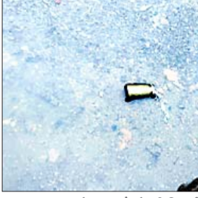
मौके से बरामद कारतूस का खोखा। डकैतों की पिटाई से पीड़ित महिला।

की। इस दौरान अपराधियों ने केंद्र में आये ग्राहकों के साथ भी मारपीट की। उधर, घटना की सूचना पाकर कतरास पुलिस और भेलाटांडा एसबीआई शाखा के प्रबंधक भी मौके पर पहुंच गए।