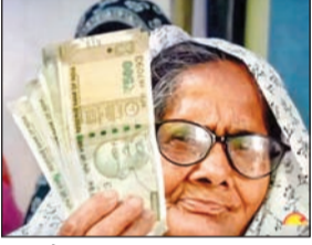
फीडबैक के आधार पर अधिक से अधिक लोगों को योजना में शामिल करने का निर्णय मुख्यमंत्री ने लिया है। योजना के तहत 28 लाख 61 हजार हितग्राहियों को मिल रहा लाभ : मुख्यमंत्री के निर्देश पर 5टी सचिव वीके पांडेयन और अन्य वरिष्ठ अधिकारियों ने विकास कार्यों की समीक्षा करने और जमीनी स्तर पर लोगों की समस्याओं को समझने के लिए विभिन्न जिलों का दौरा किया। इससे लोगों की समस्याओं का पता लगाया गया होगा। राज्य सरकार मधुबाबू पेंशन योजना के तहत 28 लाख 61 हजार

आजाद सिपाही संवाददाता भुवनेश्वर। सामाजिक सुरक्षा को महत्व देते हुए नवीन पटनायक ने मधुबाबू पेंशन योजना की परिसीमा को बढ़ा दिया है। मुख्यमंत्री नवीन पटनायक ने इस योजना में और 4 लाख 13 हजार लाभार्थियों को शामिल किया है। इसी के साथ योजना के तहत लाभार्थियों की संख्या 28 लाख 61 हजार से बढ़कर 32 लाख 75 हजार हो गई है। नए हितग्राहियों की पहली पेंशन 15 अगस्त लोक सेवा दिवस के दिन मिलेगी।