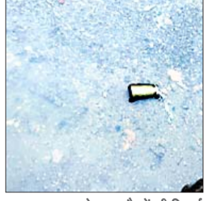
नौके से बरामद कारतूस का खोखा। डकैतों की पिटाई से पीड़ित महिला।

की। इस दौरान अपराधियों ने केंद्र में आये ग्राहकों के साथ भी मारपीट की। उधर, घटना की सूचना पाकर कतरास पुलिस और भेलाटाई एसबीआई शाखा के प्रबंधक भी मौके पर पहुंच गए।