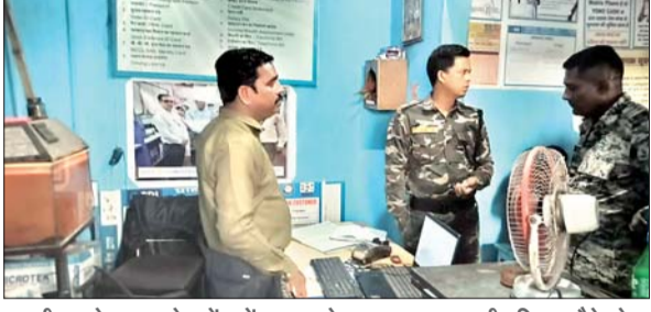
एसबीआई के ग्राहक सेवा केंद्र में लूटपाट के बाद पूछताछ करती पुलिस। नौके से बरामद कारतूस का खोखा। डकैतों की पिटाई से पीड़ित महिला।

आजाद सिपाही संवाददाता कतरास। कतरास थाना क्षेत्र के कंचनपुर पंचायत के रामपुर स्थित एसबीआई ग्राहक सेवा केंद्र में सोमवार को दिनदहाड़े हथियारबंद दो अपराधियों ने धावा बोल दिया। हथियार का भय दिखाकर संचालक व ग्राहक को कब्जे में लेकर 35 हजार रुपये नगद, मोबाइल फोन व अन्य सामान लूट कर चलते बने। भागने के क्रम में अपराधियों ने दहशत फैलाने के उद्देश्य से तीन राउंड फायरिंग भी