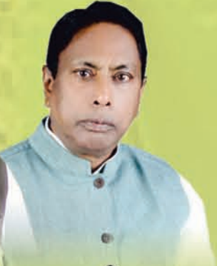
आलमगीर आलम जिन्दाबाद