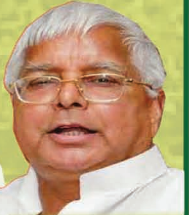
लालू यादव जिन्दाबाद