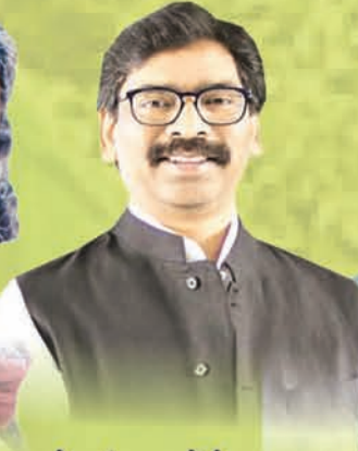
हेमंत सोरेन जिन्दाबाद