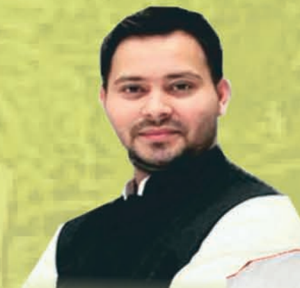
तेजस्वी यादव जिन्दाबाद