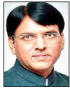
डॉ मनसुख मंडाविया

आर्थिक सर्वेक्षण 2022-23 के अनुसार, देश की लगभग 65% आबादी ग्रामीण क्षेत्रों में रहती है और 47% आजीविका के लिए कृषि पर निर्भर है। कृषि एक समयबद्ध गतिविधि है जिसमें उत्पादन और उत्पादकता को अधिकतम करने के लिए सही समय पर सही कृषि-इनपुट की आवश्यकता होती है। कृषि-इनपुट कृषि के आवश्यक तत्व हैं और एक कुशल वितरण प्रणाली कृषि आय की वृद्धि में महत्वपूर्ण भूमिका निभाती है।