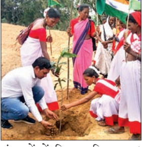
पंचायतों में शिरकत किया गया।

आजाद सिपाही संवाददाता कोडरमा। कोडरमा जिले के सभी प्रखंडों के विभिन्न पंचायतों में मेरी माटी मेरा देश के तहत विभिन्न कार्यक्रम आयोजित किया गया। इस कार्यक्रम में जिला परिषद अध्यक्ष, प्रखंड प्रमुख, प्रखंड विकास पदाधिकारी, प्रखंड कार्यक्रम पदाधिकारी और मुखियागण ने प्रखंड के कई