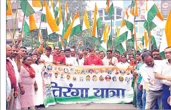
महोत्सव कहा गया इसका समापन एक वर्ष बाद हम मेरी माटी मेरा देश के कार्यक्रम से कर रहे हैं। तिरंगा यात्रा जन भागीदारी का अभियान है, जो भारत की नींव को मजबूती प्रदान कर रहा है। इसके अलावा भूली

यह केवल कहावत नहीं सच्चाई है। राष्ट्र निर्माण में सबसे बड़ा योगदान युवाओं का ही होता है। अब युवा ही राष्ट्र को आगे बढ़ाने के लिए मिल के पत्थर साबित होंगे। राष्ट्र के इस पर्व को जिस आजादी का अमृत