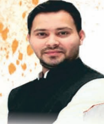
तेजस्वी यादव जिन्दाबाद