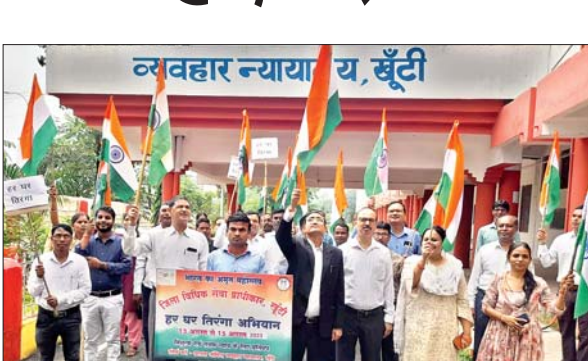
हर घर तिरंगा कार्यक्रम में शामिल प्रधान जिला जज व अन्य।