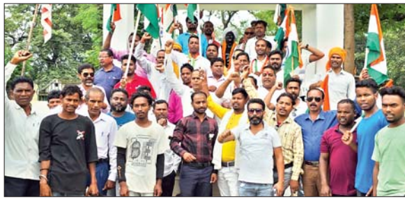
हर घर तिरंगा यात्रा में शामिल अनगड़ा के भाजपाई।