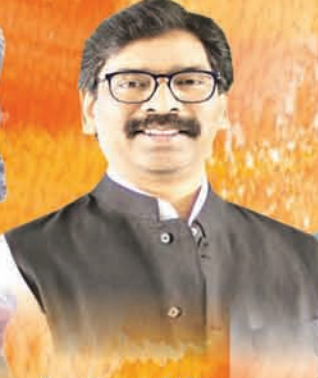
हेमंत सोरेन जिन्दाबाद