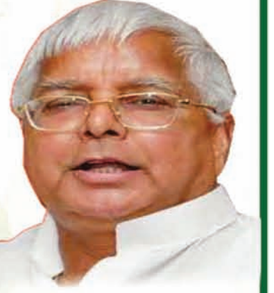
लालू यादव जिन्दाबाद