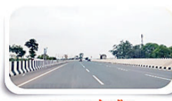
एलएच 33 परलेन चौक