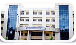
हजारीबाग मेडिकल कॉलेज व अस्पताल