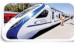
हजारीबाग को बंदे भारत की सीमागत

समस्त रामगढ़ वासियों को 77 वें स्वतंत्रता दिवस की हार्दिक शुभकामनाएं