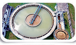
हर घर, शुद्ध जल