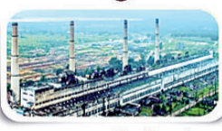
पतरातू सुपर धर्मल पॉवर प्लांट