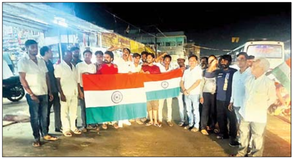
पिस्कानगड़ी में जश्न मनाते युवा मंडल के कार्यकर्ता और बेड़ों में जश्न मनाते भाजपा कार्यकर्ता