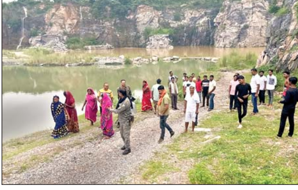
देखा लड़की का शव जहां था वहीं फंसा रहा वहीं लड़के का