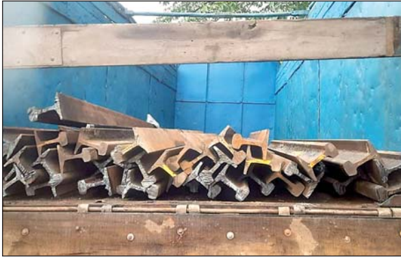
गिरफ्तारी के बाद ही यह तय हो पायेगा की रेलवे का कटिंग पट्टरी कहां से चुराया गया है। चुराया गया रेलवे का कटिंग पट्टरी इसी वर्ष का

कोडरमा। तिलैया थाना क्षेत्र के गझांडी रोड स्थित प्रतीक स्टील प्लांट के मुख्य द्वार से रेलवे का लोहा (पट्टरी) से भरा ट्रक को आरपीएफ ने बरामद किया है। जबकि ट्रक चालक और खलासी चाबी लगा छोड़कर फरार हो गया। ट्रक में लगभग 35 पीस रेलवे का कटिंग पट्टरी लोड था। फिलहाल टाउन पुलिस व आरपीएफ के बीच क्षेत्राधिकार को लेकर अपने-अपने दावे करने में लगी है। मामला जो भी हो अब तो आरोपियों की