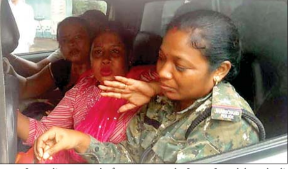
सरकारी काम में बाधा पहुंचाने और पांच लाख रुपये की रंगदारी मांगने के आरोप में दो महिलाओं को गिरफ्तार कर ले जाती पुलिस। बासदेवपुर में कैद करती पुलिस।

दोनों महिलाओं ने निगम व पुलिस पर लगाया झूठे मामले में फ़ैसाले का आरोप आजाद सिपाही संवाददाता