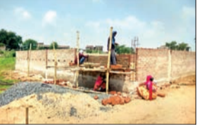
चारदीवारी नहीं होने की स्थिति में लगातार भू माफियाओं द्वारा जमीन को हड़पा जा रहा है।

मेदिनीनगर। विद्यार्थी परिषद के कार्यकर्ताओं ने आरोप लगाया कि नीलांबर पोतान्वर विश्वविद्यालय की जमीन भू माफियाओं एवं असांजिक तत्वों द्वारा हड़पा जा रहा है। कहा कि गणेश लाल अग्रवाल महाविद्यालय के पास 84 एकड़ जमीन थी जिसमें सर्वसम्पत्ति से 25 एकड़ विश्वविद्यालय के निर्माण के लिए दिया गया था। पर विश्वविद्यालय की