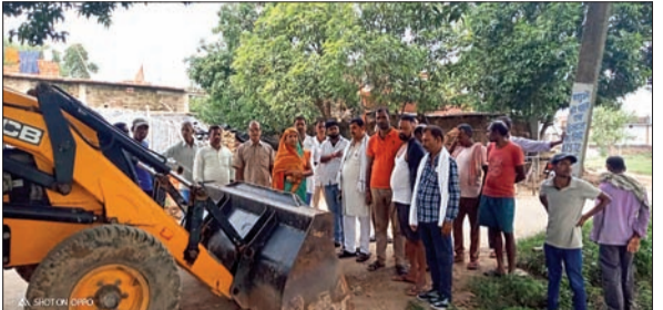
आजाद सिपाही संवाददाता

- रामेश्वर बांध से निकली पड़न के सफाई कार्य का विधायक ने किया ऑनलाइन शिलान्यास - कहा सभी पंचायतों में सरकार करा रही कूप निर्माण, जरूरतमंद किसान आवेदन देकर उठाएँ लाभ