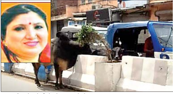
सड़क किराने लगे पौधों को खाता मवेशी।

मेदिनीनगर। इन दिनों महात्मा गांधी मार्ग में लगे कंक्रीट डिवाइडर, हरे-भरे पौधे और सुंदर लाइटों को शहर में विशेष चर्चा है। रात को तो शहर की खूबसूरती डिवाइडर युक्त लाइट एवं पौधों से और भी बढ़ जाती है। वहीं आवागमन भी सुगम हो गया है, लेकिन शहर में घूम रहे लावारिस मवेशी प्रतिदिन डिवाइडर में लगे पौधों को खाता जा रहे हैं। आश्चर्य इस बात का है कि अगल-बगल के लोग मवेशियों को पौधे खाते देखते भी हैं लेकिन हटते नहीं हैं। निगम भी इन लावारिस मवेशियों